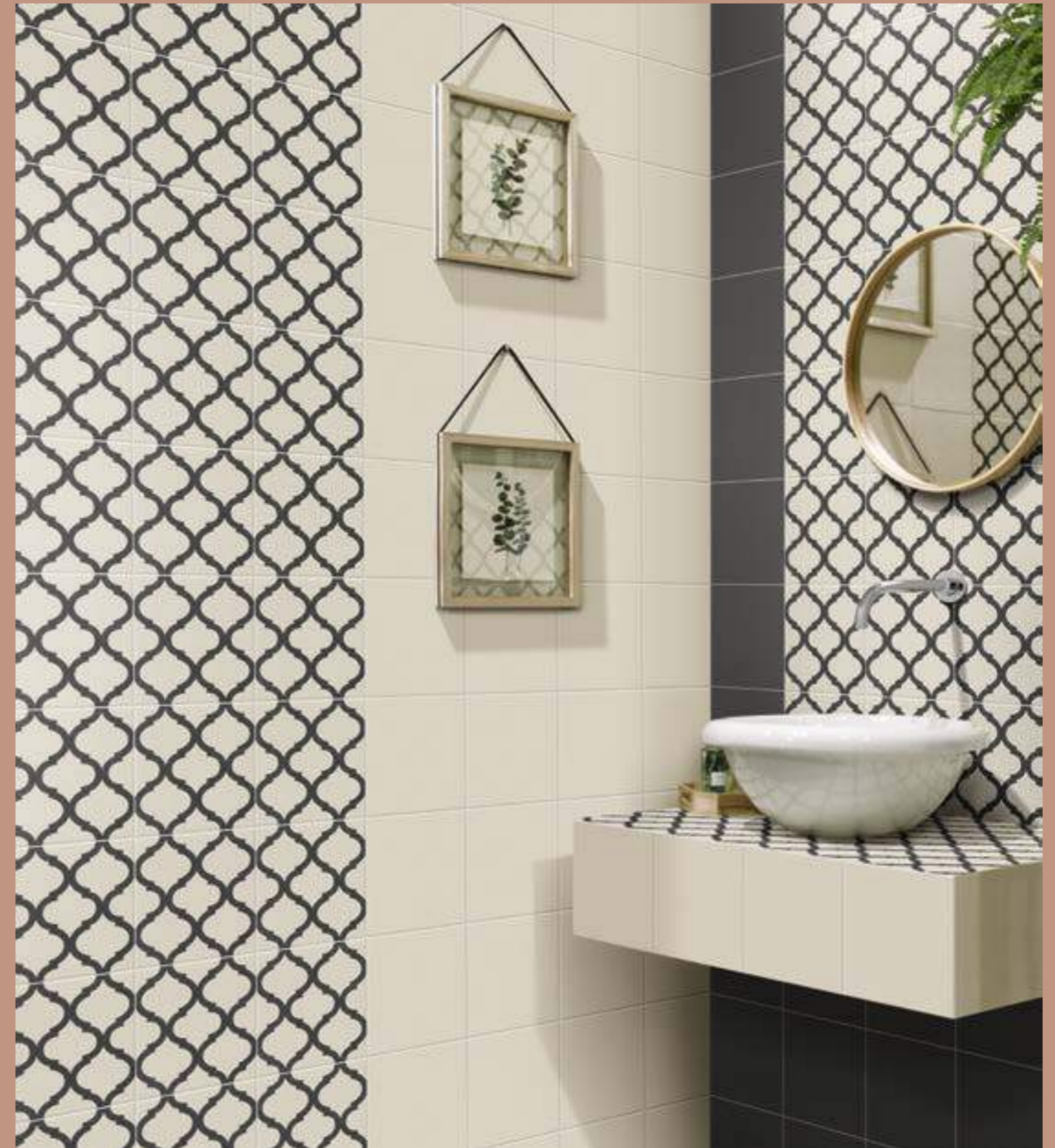
Meknes 20x20 - Victorian Blanco 20x20 - Victorian Gris 20x20