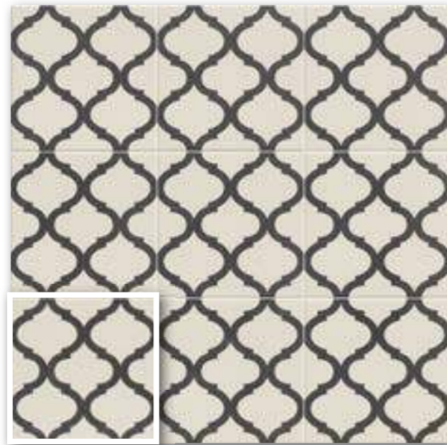
▲ MEKNES 20x20 (M-280) 8"x8"