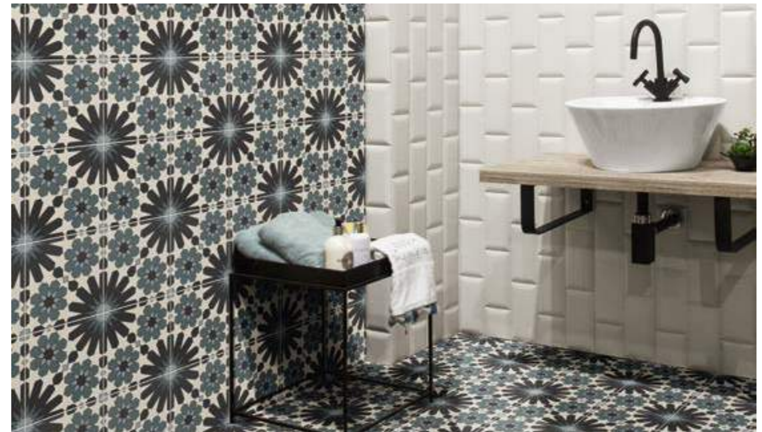
Tanger 20x20 · Bumpy White 10x20