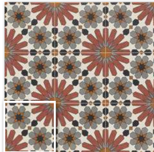
▲ MEDINA 20x20 (M-280) 8"x8"