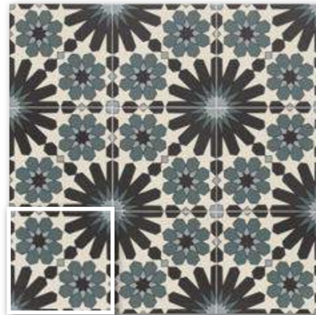
▲ TANGER 20x20 (M-280) 8"x8"