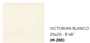
VICTORIAN BLANCO 20x20 - 8"x8" (M-280)