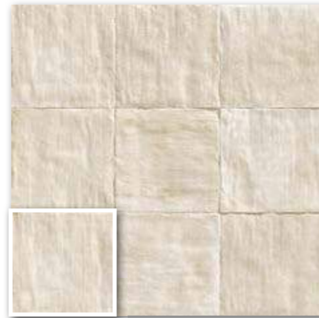
▲ TUSCANIA BEIGE 20x20 (M-220) 8"x8"