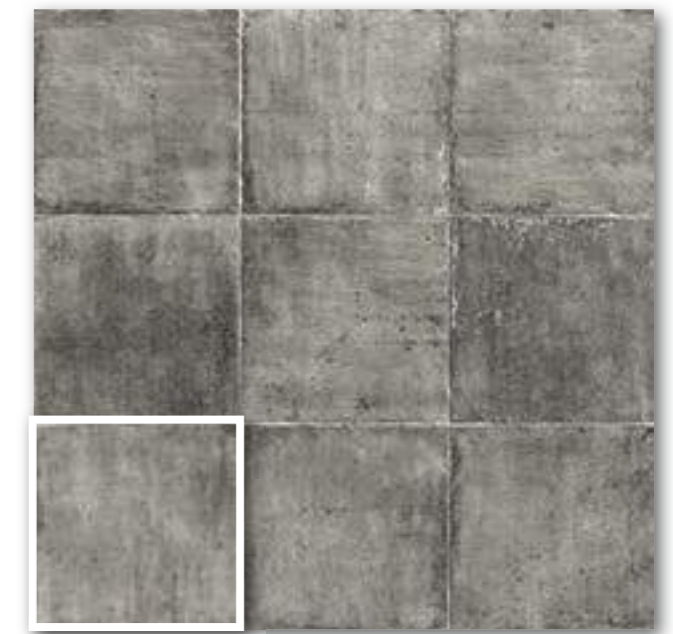
▲ TUSCANIA BLACK 20x20 (M-220) 8"x8"