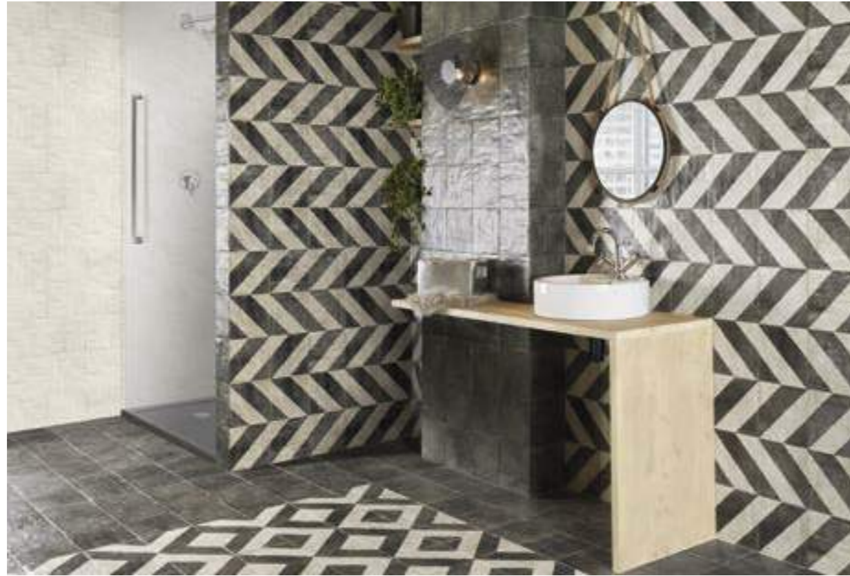
Tuscania White 20x20 · Tuscania Black 20x20 · Bergamo 20x20