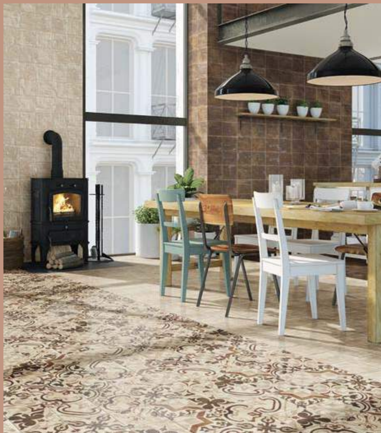
Tuscania Beige 20x20 · Tuscania Choco 20x20 · Loreto 20x20