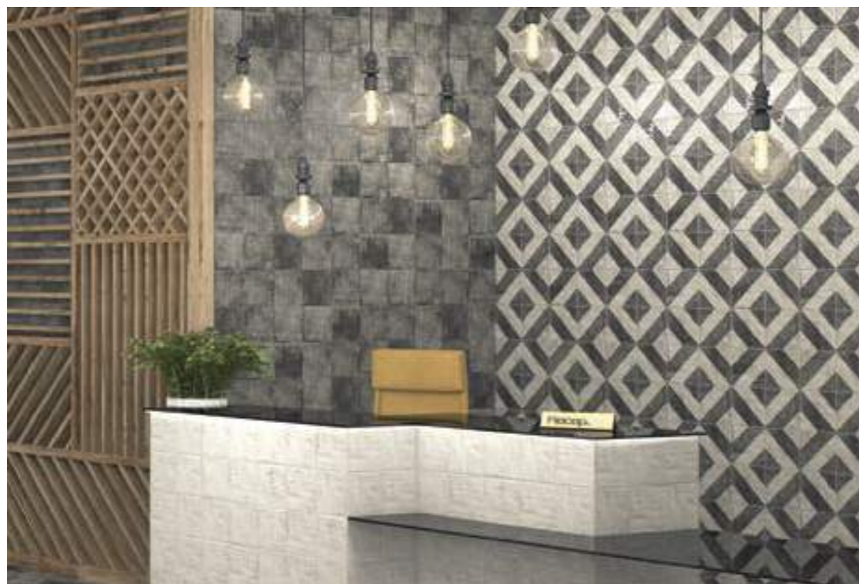
Tuscania White 20x20 · Tuscania Black 20x20 · Bergamo 20x20