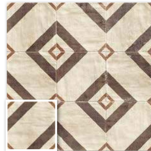
▲ VITERBO 20x20 (M-220) 8"x8"