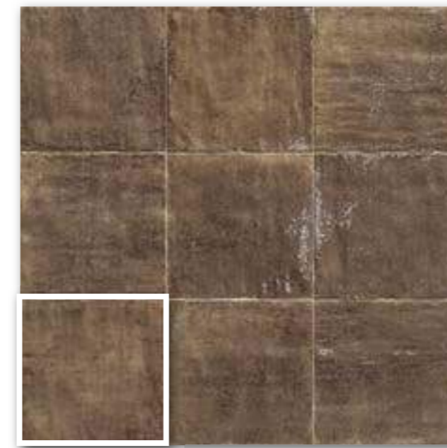
▲ TUSCANIA CHOCO 20x20 (M-220) 8"x8"