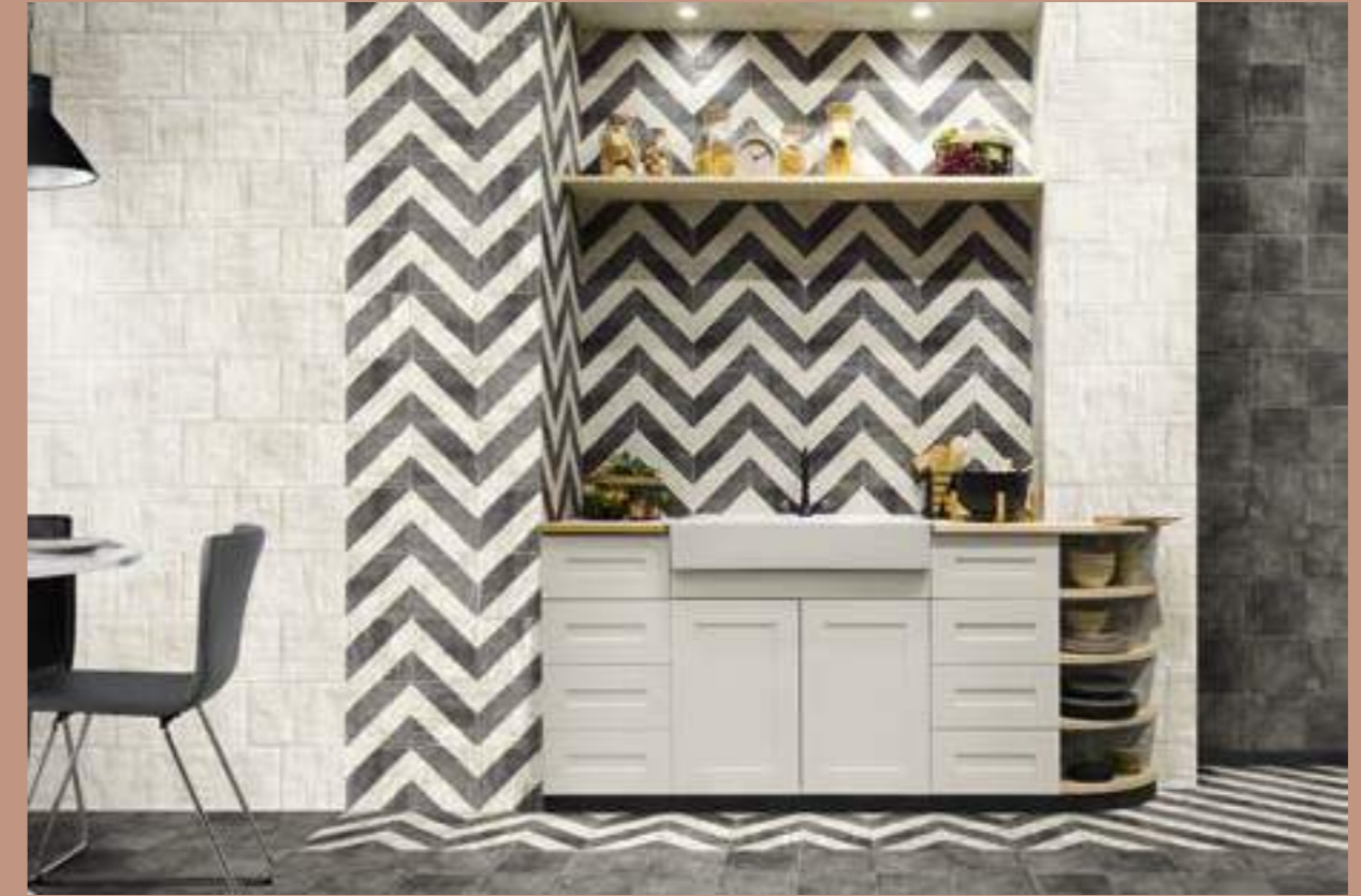
Tuscania White 20x20 · Tuscania Black 20x20 · Bergamo 20x20