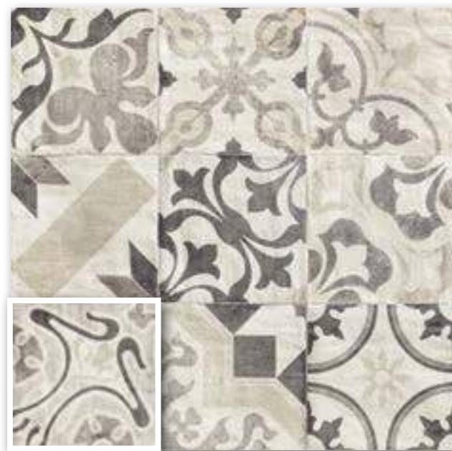
▲ LAVELLO 20x20 (M-220) 8"x8"