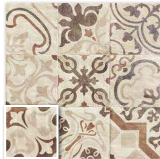
▲ LORETO 20x20 (M-220) 8"x8"