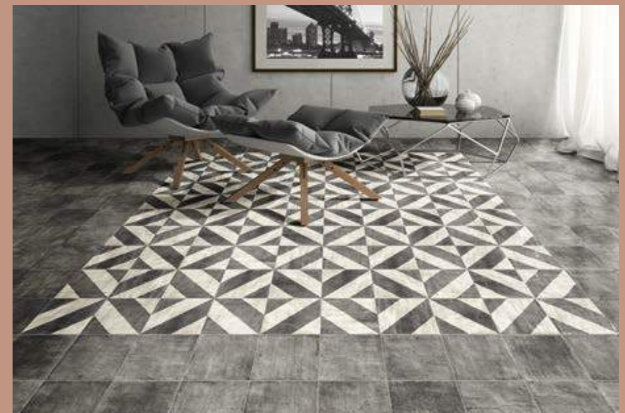
Tuscania Black 20x20 · Bergamo 20x20