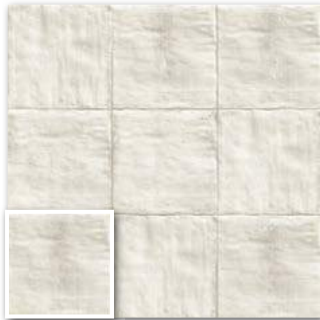
▲ TUSCANIA WHITE 20x20 (M-220) 8"x8"