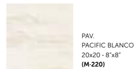
PAV. PACIFIC BLANCO 20x20 - 8"x8" (M-220)