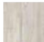
PAV. PACIFIC GREEN 20x20 - 8"x8" (M-220)

Ver serie completa en pág. 268 Check complete serie in page 268