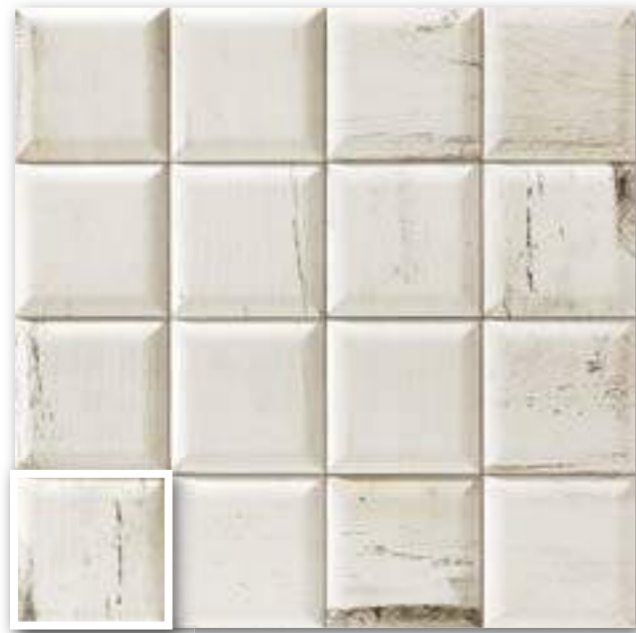
▲ SOHO BLANCO 15x15 (M-280) 6"x6"