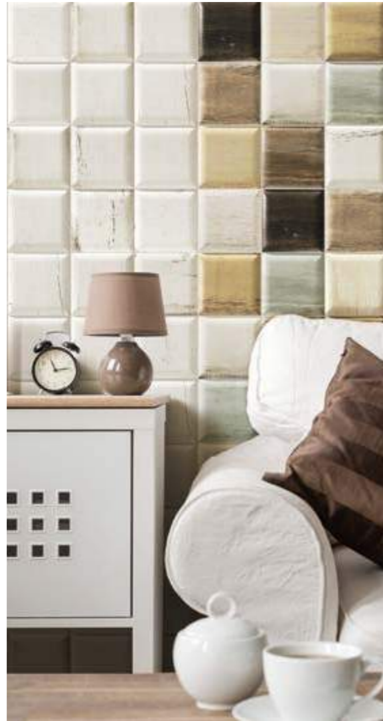
Soho Blanco 15x15 · Soho Mix 15x15