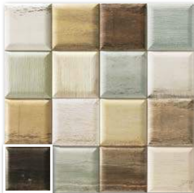
▲ SOHO MIX 15x15 (M-280) 6"x6"