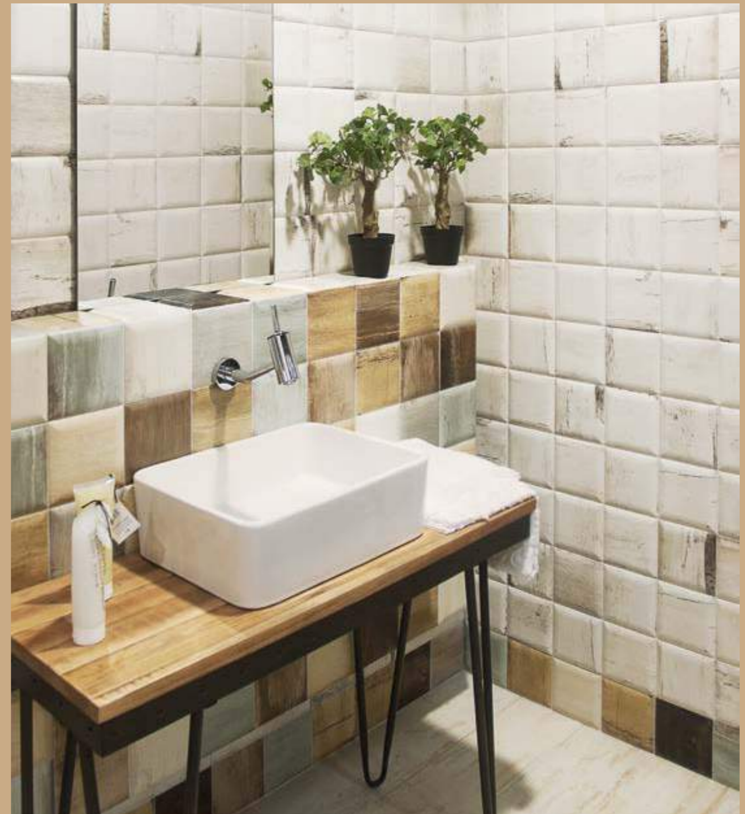
Soho Blanco 15x15 · Soho Mix 15x15 · Pav. Pacifico Blanco 20x20