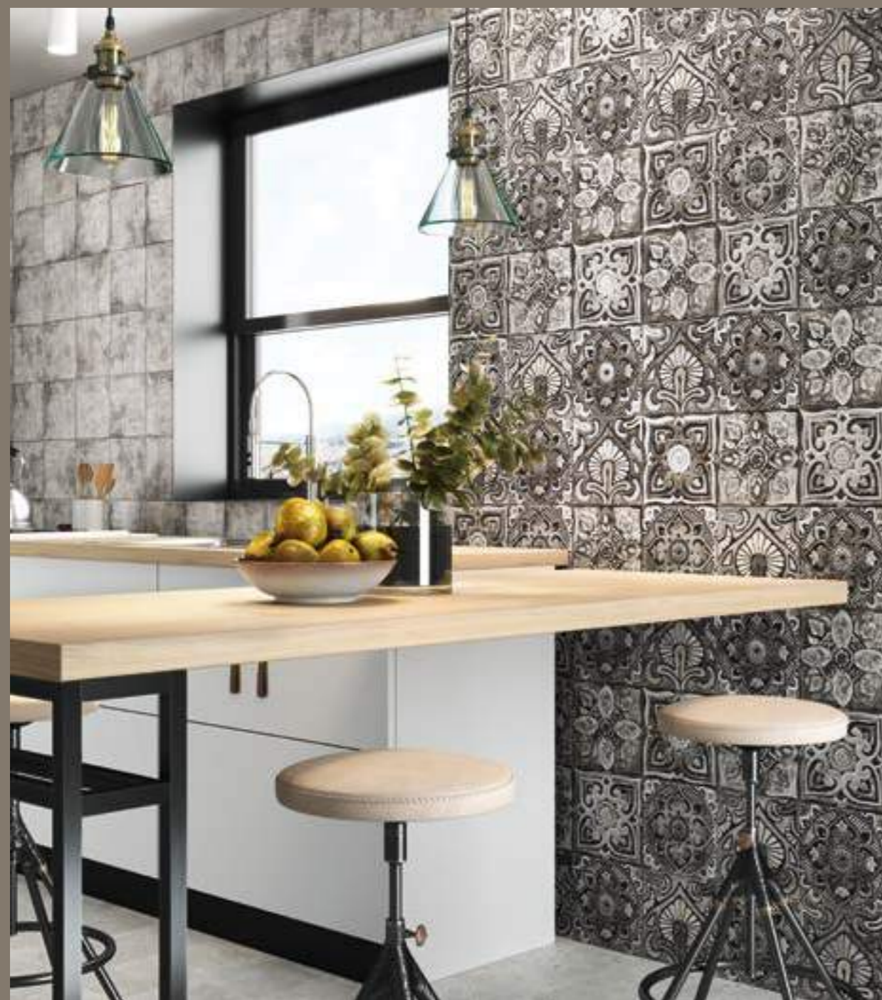
Mandala Grey 20x20 · Centro Mystikos 20x20