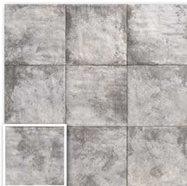
▲ MANDALA GREY 20x20 (M-152) 8"x8"