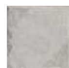
NORLAND GREY 20x20 - 8"x8" (M-280)