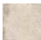
NORLAND WHITE 20x20 - 8"x8" (M-280)