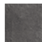
NORLAND BLACK 20x20 - 8"x8" (M-280)

Ver serie completa en CATÁLOGO NORLAND Check complete serie in NORLAND CATALOGUE