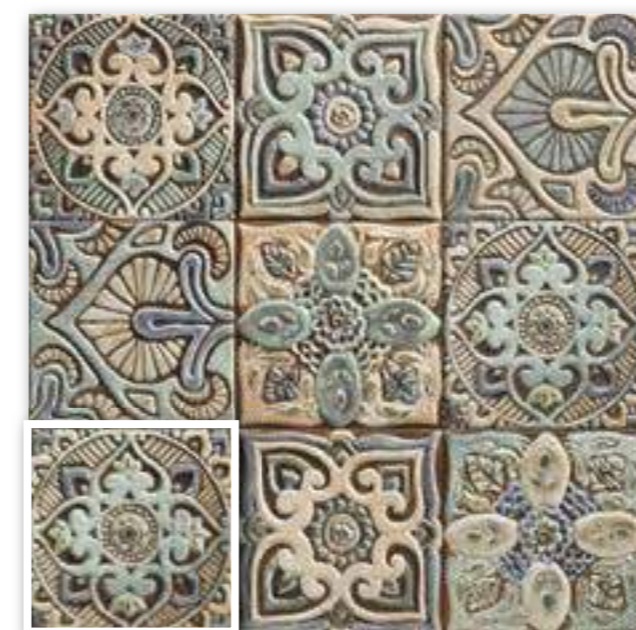
▲ CENTRO MANDALA 20x20 (M-320) 8"x8"