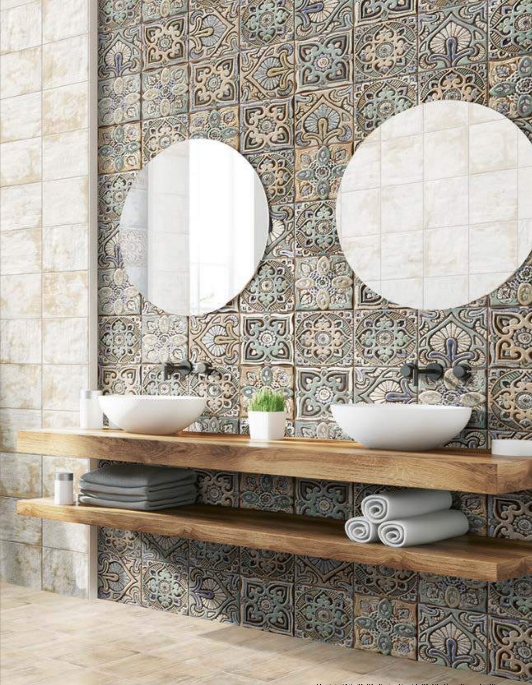
Mandala White 20x20 · Centro Mandala 20x20 · Aterra Crema 15x30