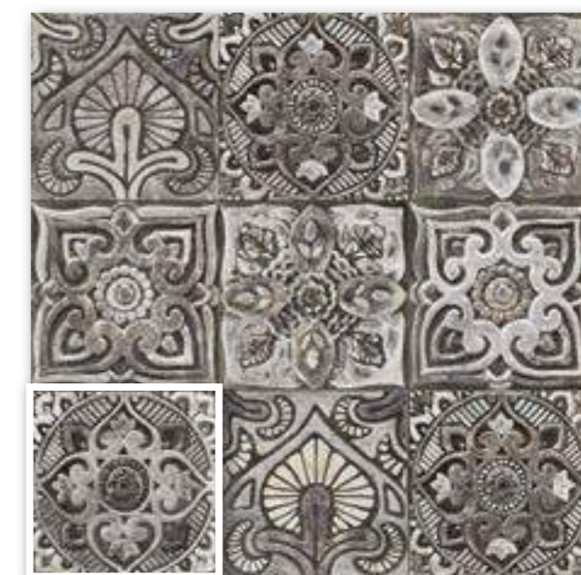
▲ CENTRO MYSTIKOS 20x20 (M-320) 8"x8"