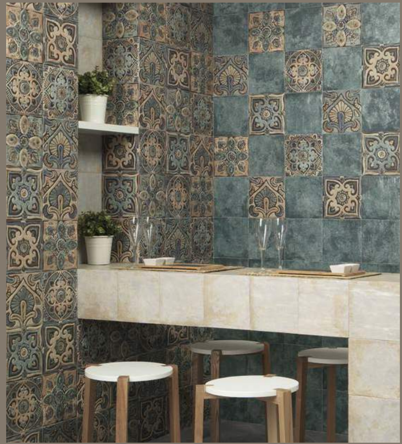
Mandala White 20x20 - Mandala Green 20x20 - Centro Mandala 20x20