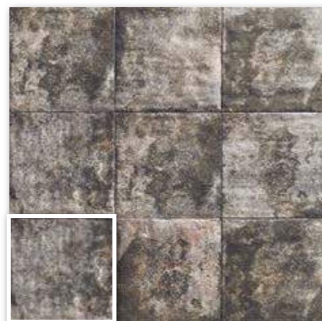
▲ MANDALA BLACK 20x20 (M-152) 8"x8"