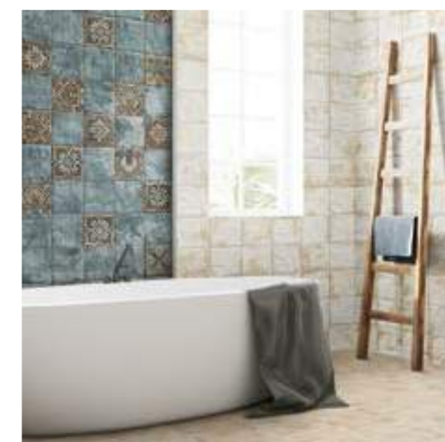
Mandala White 20x20 - Mandala Green 20x20 Centro Mandala 20x20 - Aterra Crema 15x30