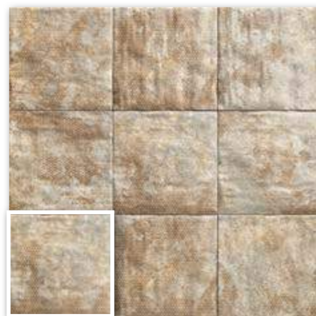
▲ MANDALA BROWN 20x20 (M-152) 8"x8"