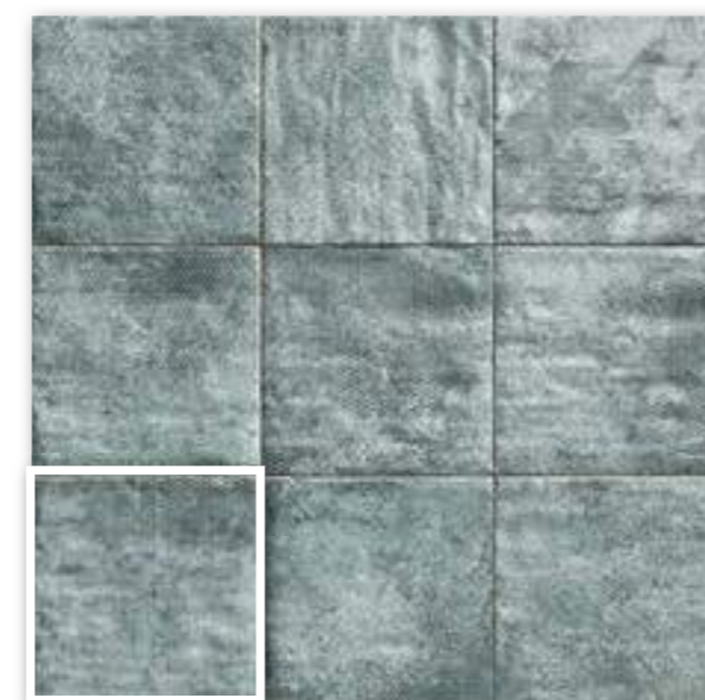
▲ MANDALA GREEN 20x20 (M-152) 8"x8"