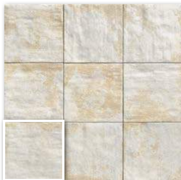
▲ MANDALA WHITE 20x20 (M-152) 8"x8"