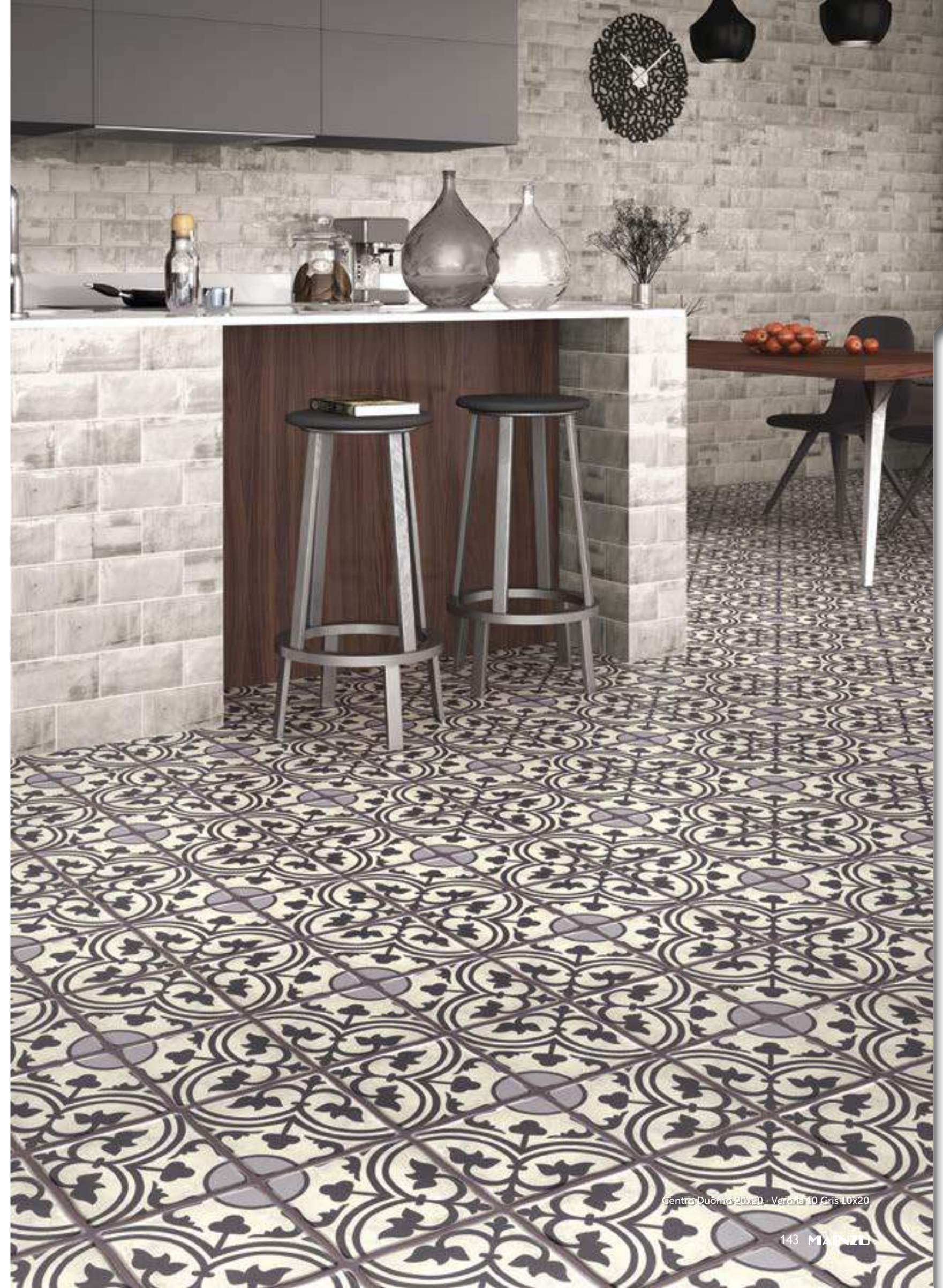
Centro Duomo 20x20 - Verona 10 Gris 10x20