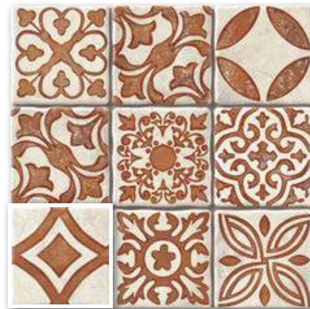
▲ MONZA TERRA 20x20 (M-220) 8"x8"