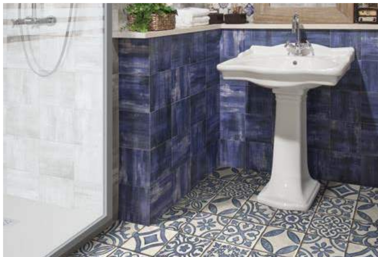
Monza Blu 20x20 - Etrusco Blu 20x20 - Etrusco Naturale 20x20