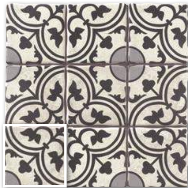
▲ CENTRO DUOMO 20x20 (M-220) 8"x8"