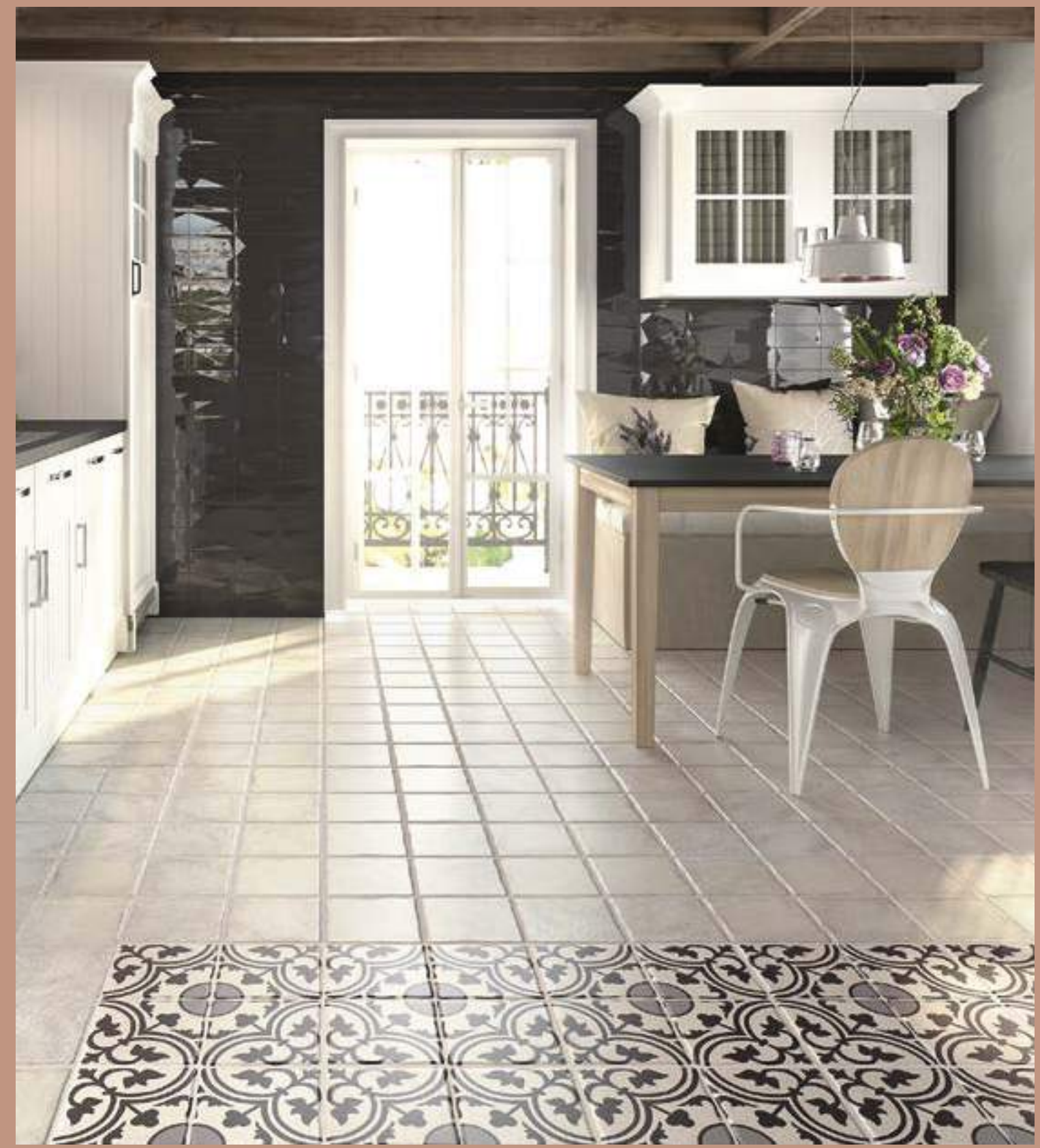
Centro Duomo 20x20 - Duomo Blanco 20x20 - Diamond Graphite 10x20