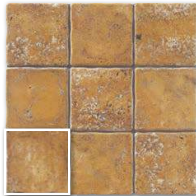
▲ DUOMO OCRE 20x20 (M-220) 8"x8"