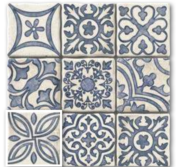
▲ MONZA BLU 20x20 (M-220) 8"x8"