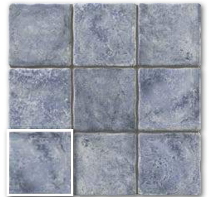
▲ DUOMO BLU 20x20 (M-220) 8"x8"