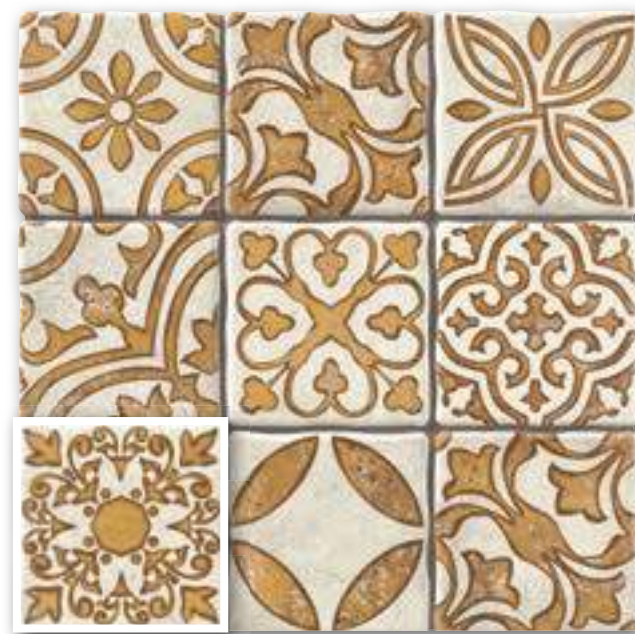
▲ MONZA OCRE 20x20 (M-220) 8"x8"