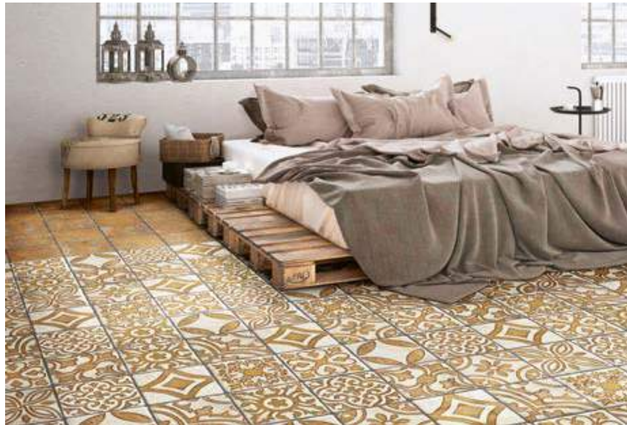
Monza Ocre 20x20 - Duomo Ocre 20x20