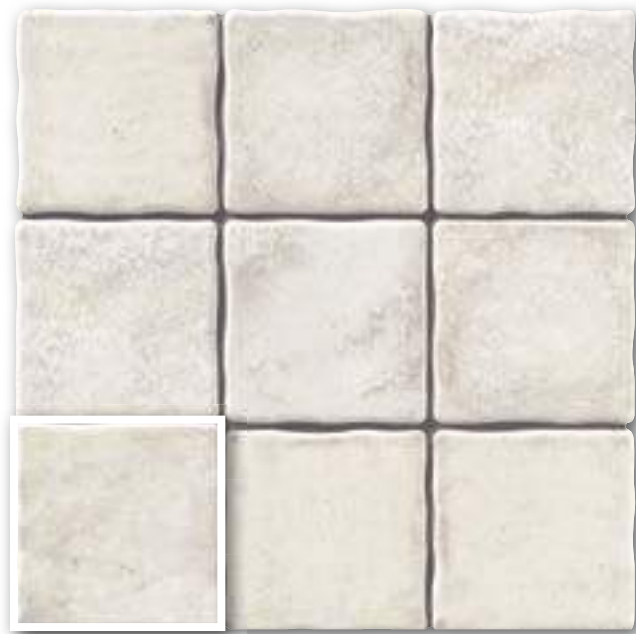
▲ DUOMO BLANCO 20x20 (M-220) 8"x8"