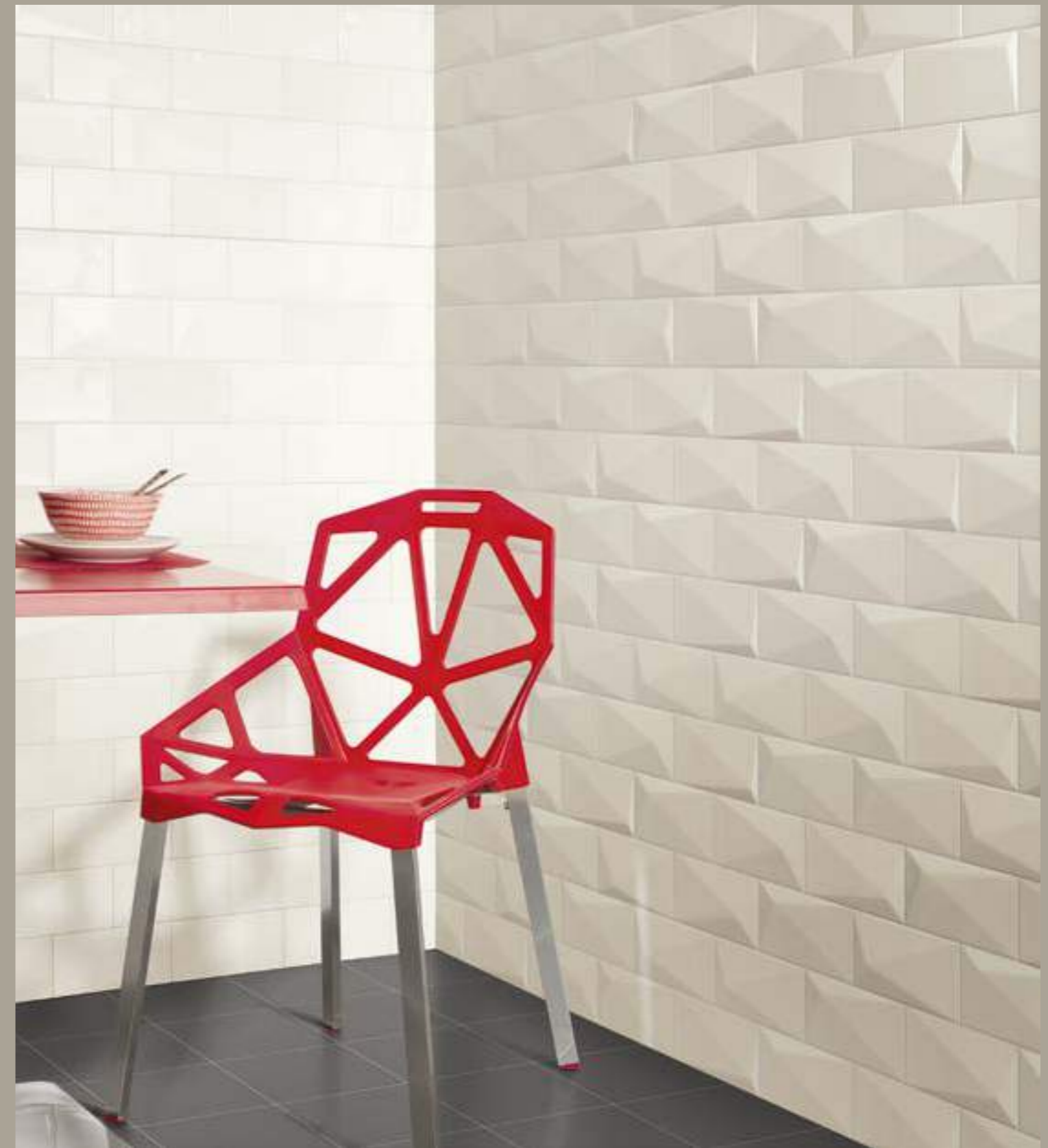
Diamond Artic 10x20 - Victorian Gris 20x20