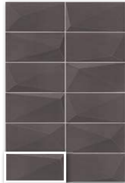
▲ DIAMOND GRAPHITE 10x20 (M-220) 4"x8"