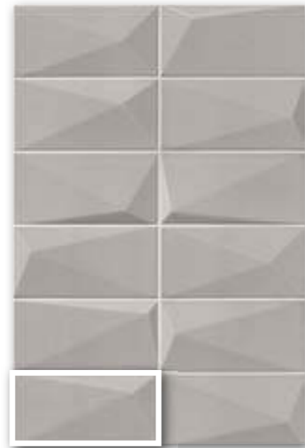
▲ DIAMOND PEARL 10x20 (M-220) 4"x8"