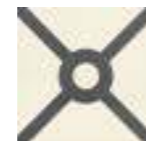
CHELSEA 20x20 - 8"x8" (M-280)