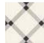
BANBURY 20x20 - 8"x8" (M-280)

Ver serie completa en pág. 160 Check complete serie in page 160