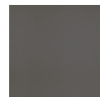
VICTORIAN GRIS 20x20 - 8"x8" (M-280)