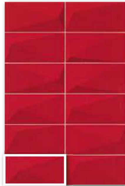
▲ DIAMOND RUBI 10x20 (M-280) 4"x8"