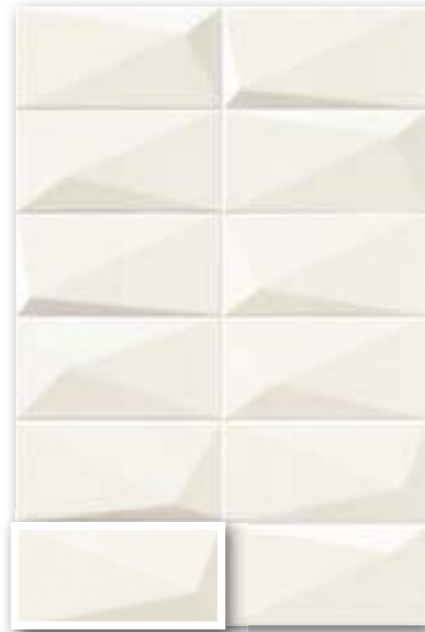
▲ DIAMOND ARTIC 10x20 (M-190) 4"x8"