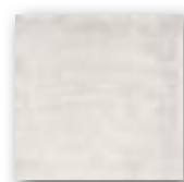
CALABRIA BLANCO 15x15 (M-152) 6"x6"