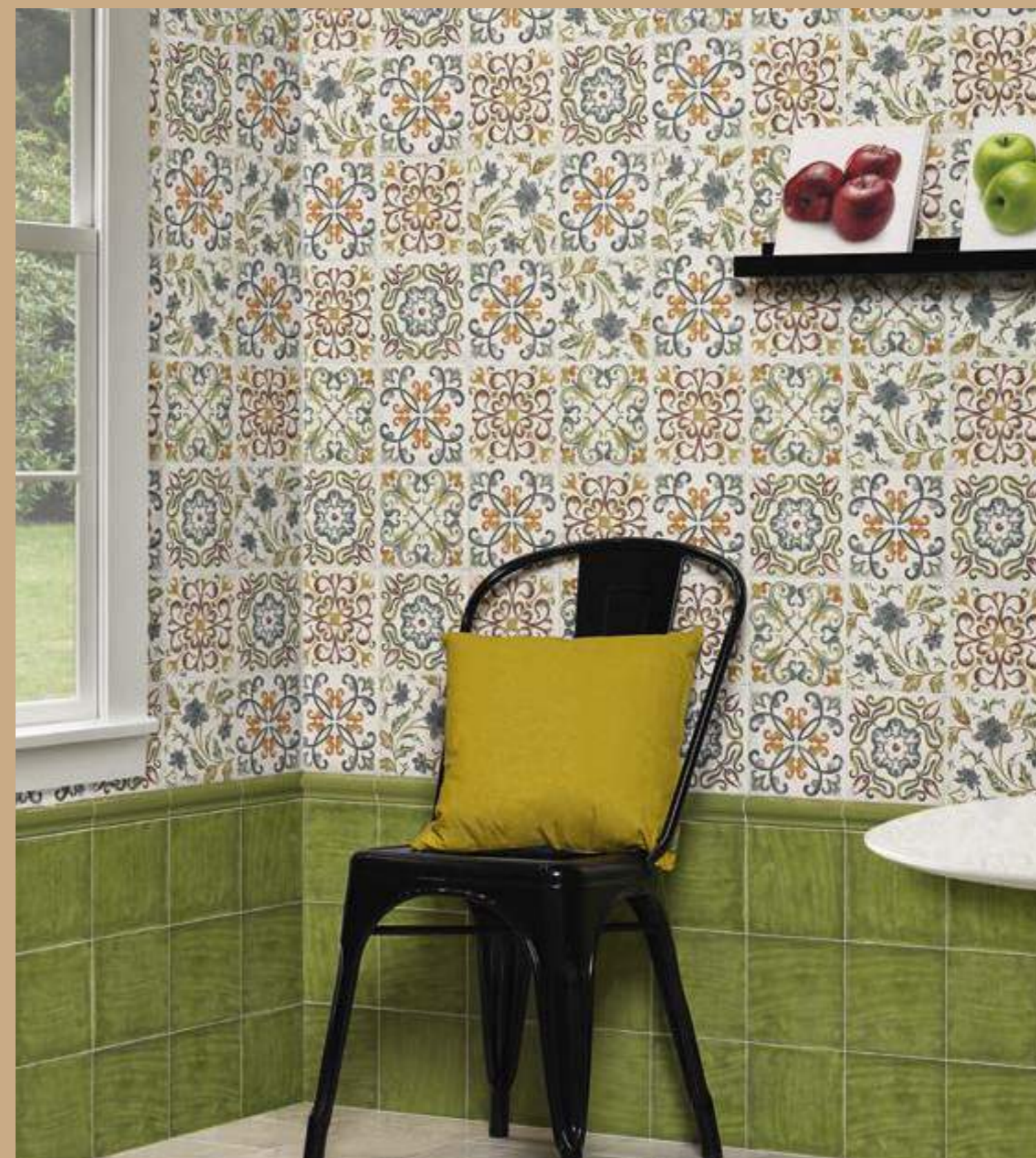
Calabria Pistacho 15x15 · Torelo Calabria Pistacho 2x15 · Decor Bambola 15x15