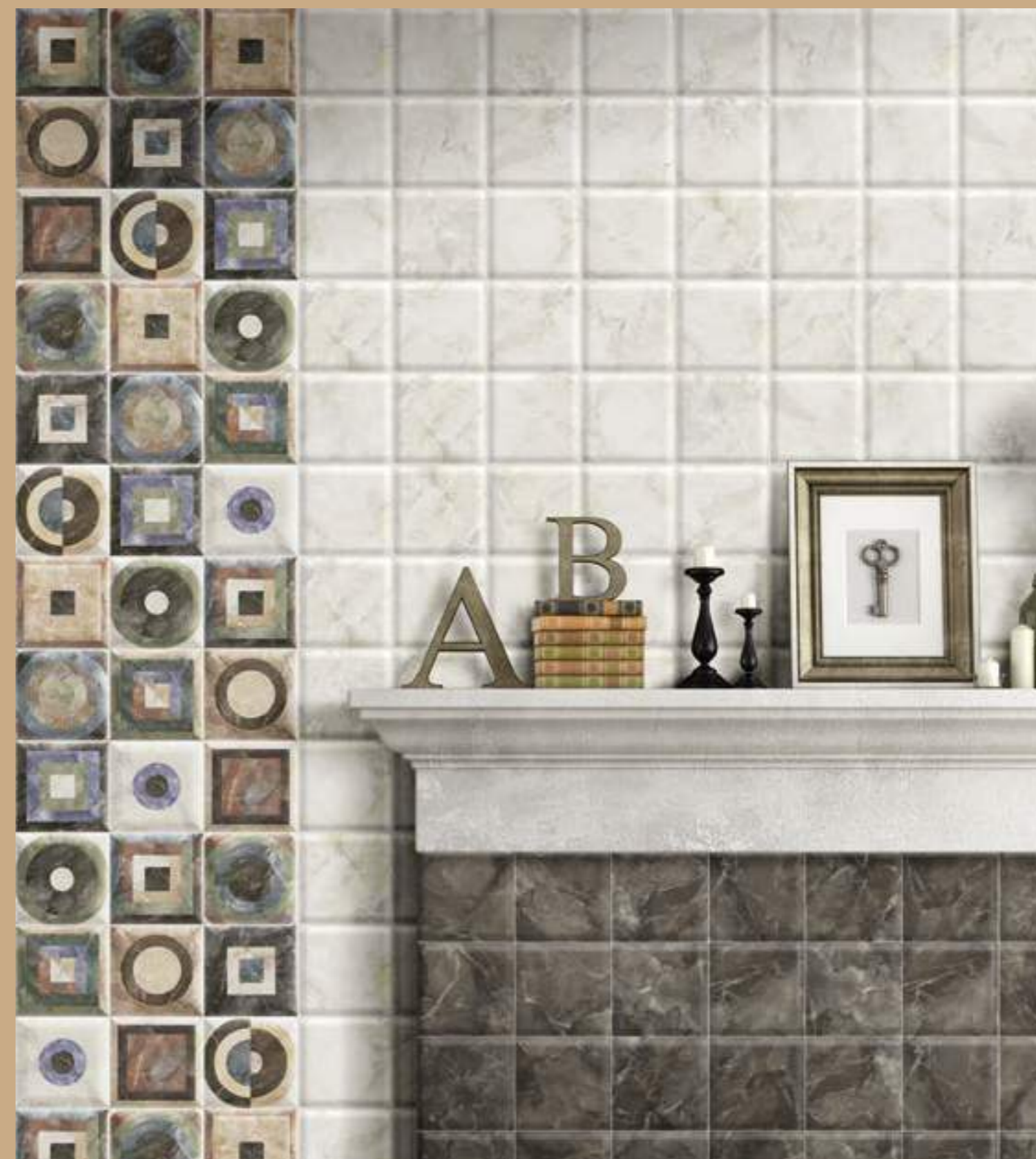
Davinci Black 15x15 · Davinci Blanco 15x15 · Decor Fontana 15x15