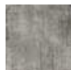
TUSCANIA BLACK 20x20 - 8"x8" (M-220)

Ver serie completa en pág. 108 Check complete serie in page 108