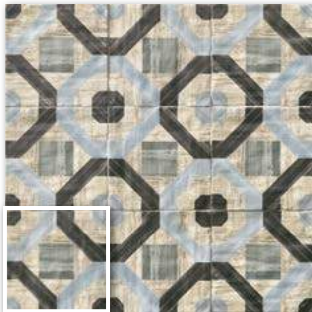
▲ PAV. ATLANTIC 20x20 (M-220) 8"x8"