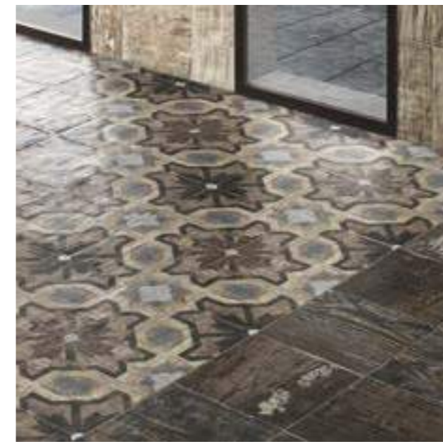
Pav. Colonial Mango 20x20 · Pav. Colonial Caoba 20x20 · Pav. Orleans 20x20