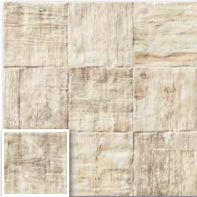
▲ PAV. COLONIAL MANGO 20x20 (M-220) 8"x8"