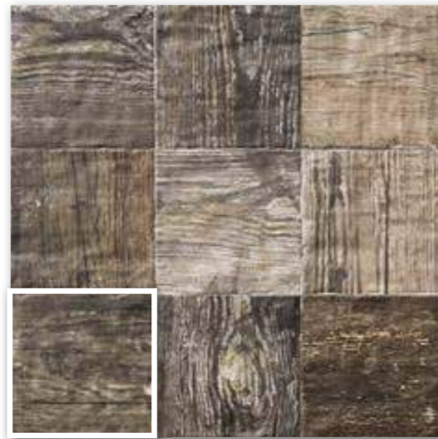
▲ PAV. COLONIAL CAOBA 20x20 (M-220) 8"x8"