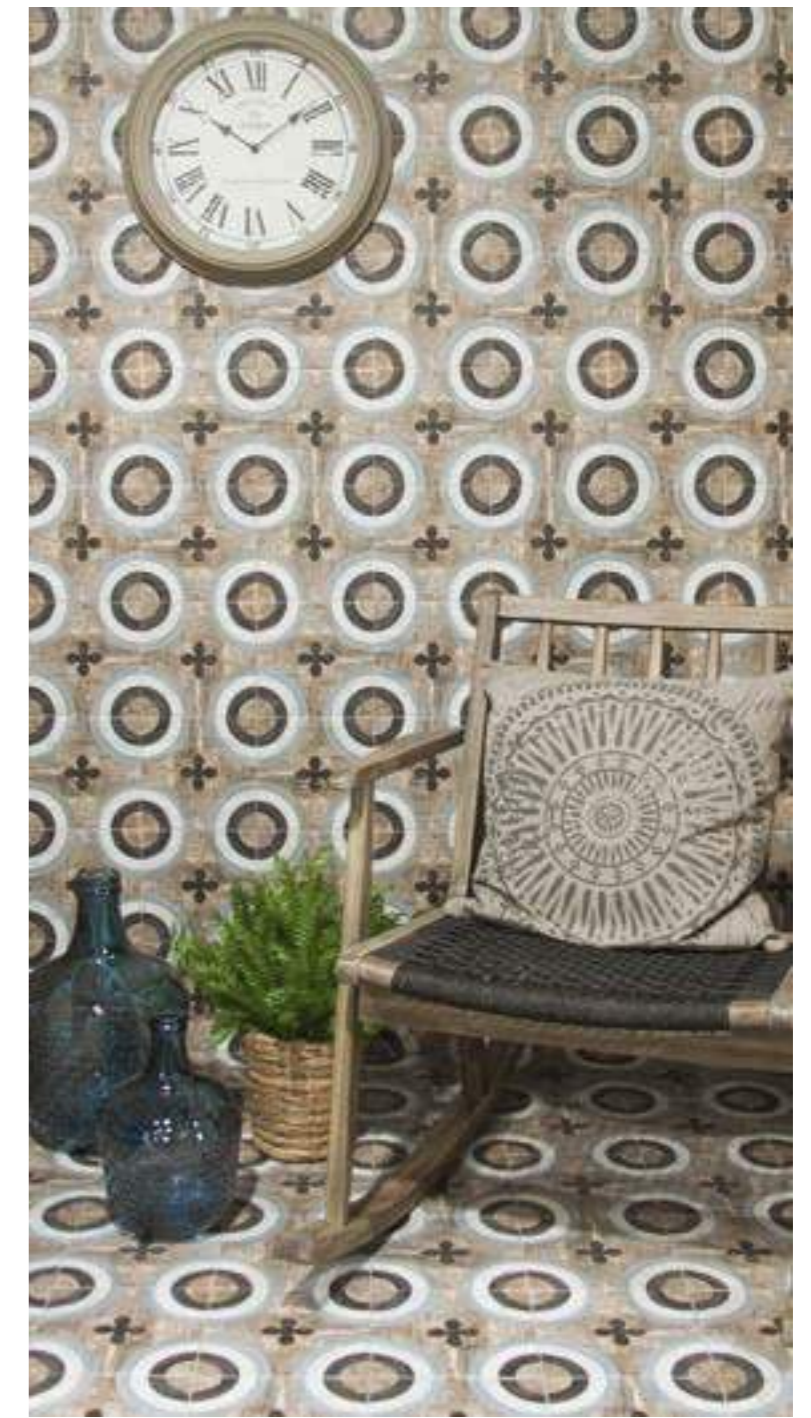
Pav. Louisiana 20x20