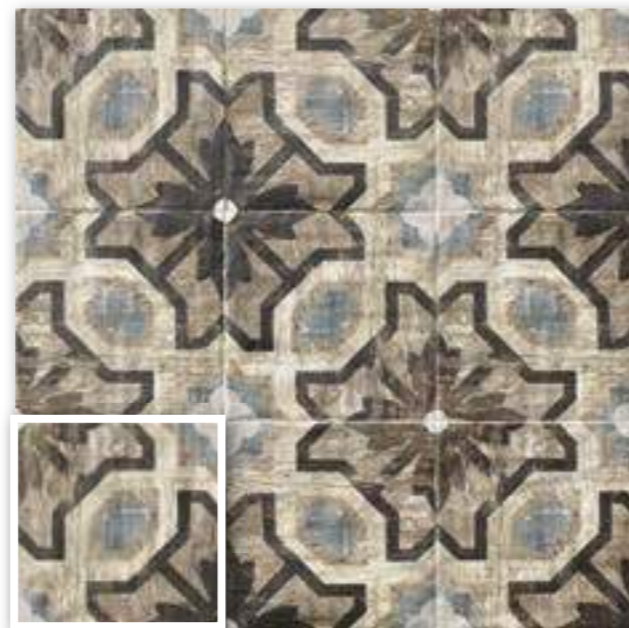
▲ PAV. ORLEANS 20x20 (M-220) 8"x8"