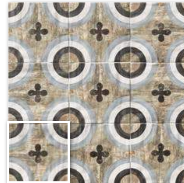
▲ PAV. LOUISIANA 20x20 (M-220) 8"x8"