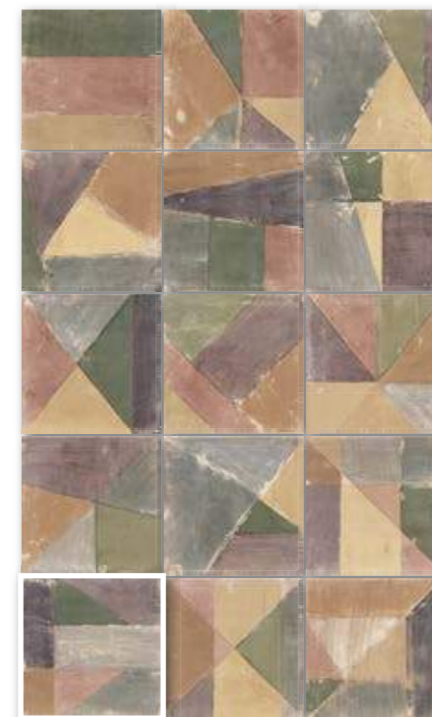
▲ DECOR BRUSH OCRE 20x20 (M-220) 8"x8"