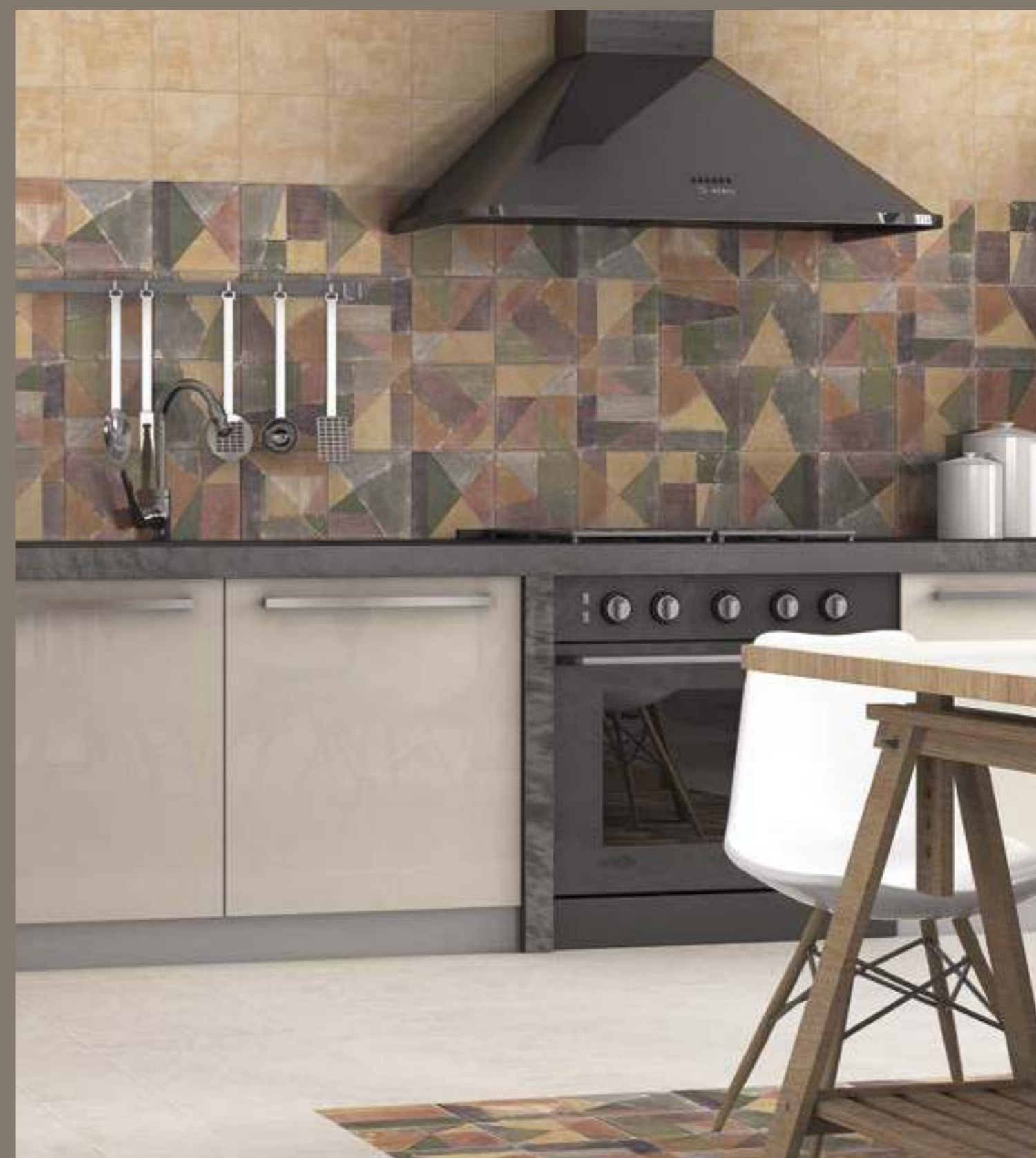
Cementine Blanco 20x20 · Cementine Ocre 20x20 · Decor Brush Ocre 20x20