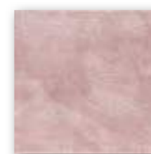
CEMENTINE ROSSO 20x20 (M-130) 8"x8"