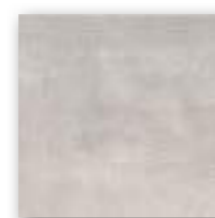
CEMENTINE GRIS 20x20 (M-130) 8"x8"