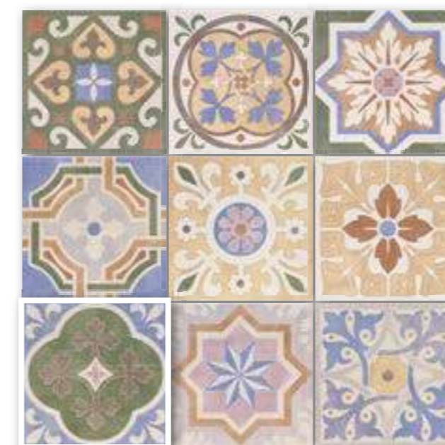
▲ DECOR BASTIDE MIX 20x20 (M-220) 8"x8"