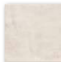
CEMENTINE BLANCO 20x20 (M-130) 8"x8"