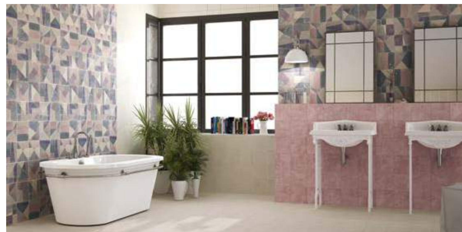
Cementine Blanco 20x20 · Cementine Rosso 20x20 · Decor Brush Azul 20x20