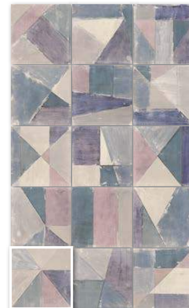
▲ DECOR BRUSH AZUL 20x20 (M-220) 8"x8"