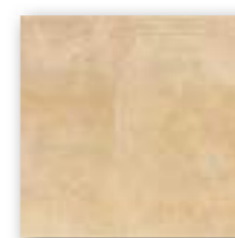
CEMENTINE OCRE 20x20 (M-130) 8"x8"