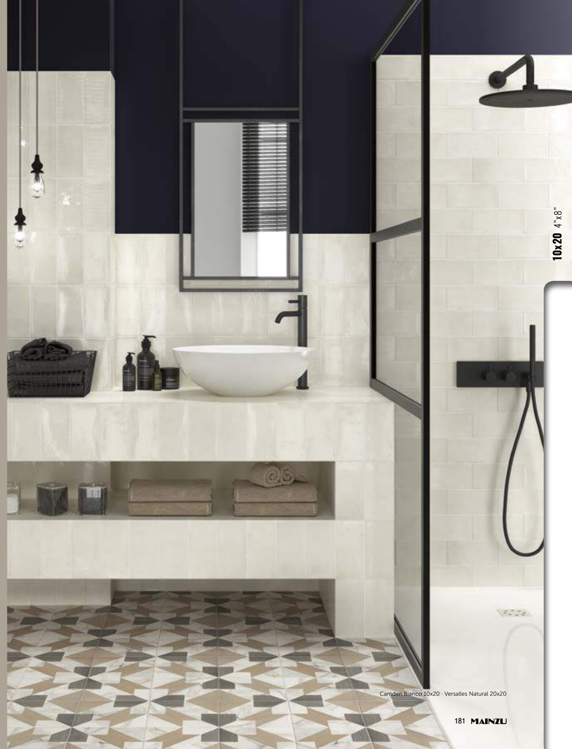
Camden Bianco 10x20 - Versailles Natural 20x20