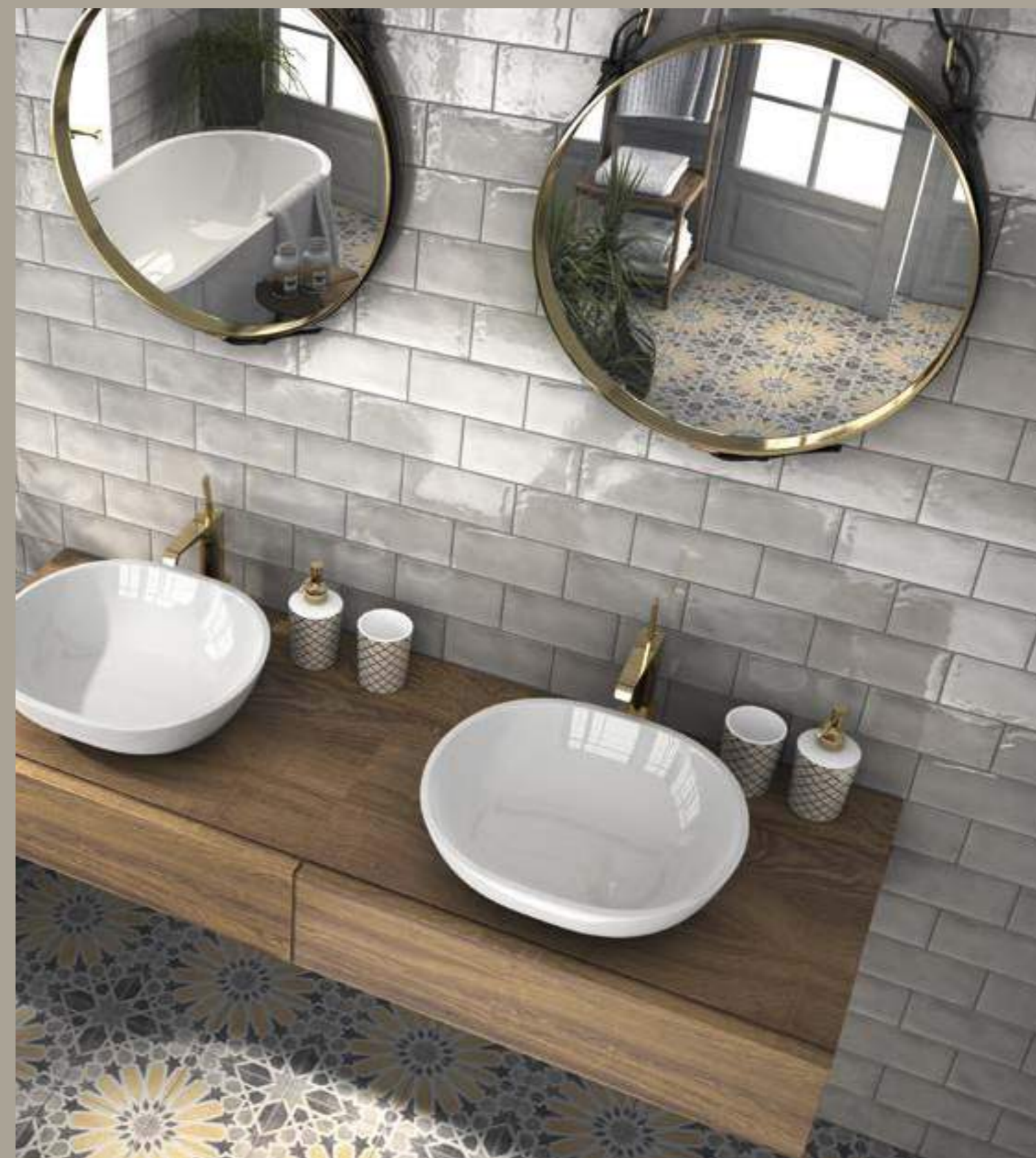
Camden Grey 10x20 - Guadix 20x20