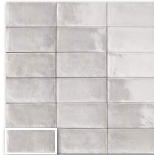
▲ CAMDEN GREY 10x20 (M-190) 4"x8"