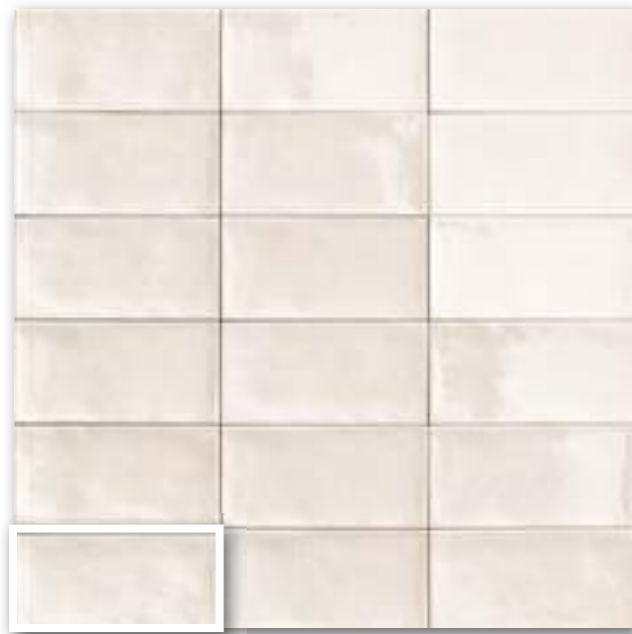
▲ CAMDEN BIANCO 10x20 (M-190) 4"x8"