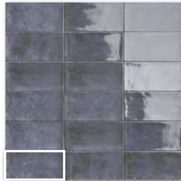
▲ CAMDEN AZURRO 10x20 (M-190) 4"x8"