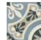
CENTRO VIENA 20x20 - 8"x8" (M-280)