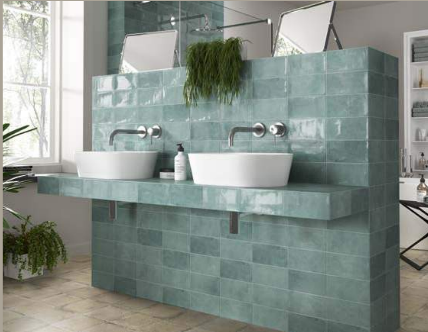
Camden Emerald 10x20 - Norland Beige 20x20