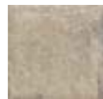
NORLAND BEIGE 20x20 - 8"x8" (M-280)