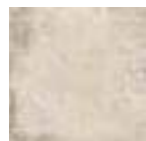
NORLAND WHITE 20x20 - 8"x8" (M-280)