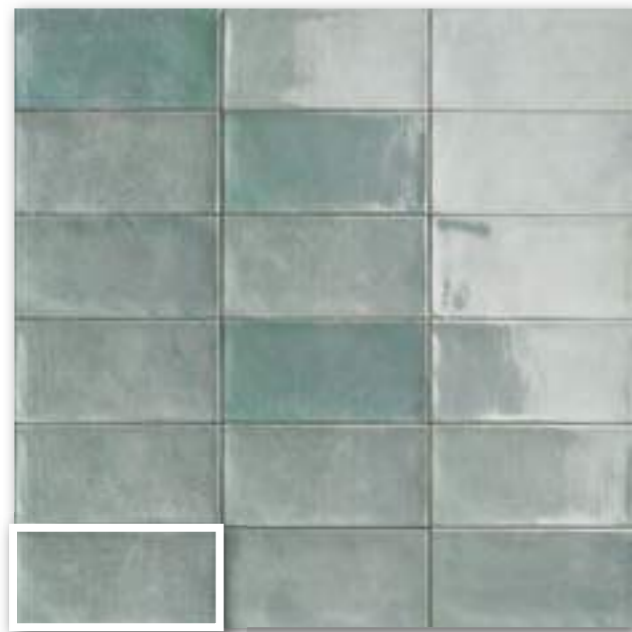
▲ CAMDEN EMERALD 10x20 (M-190) 4"x8"