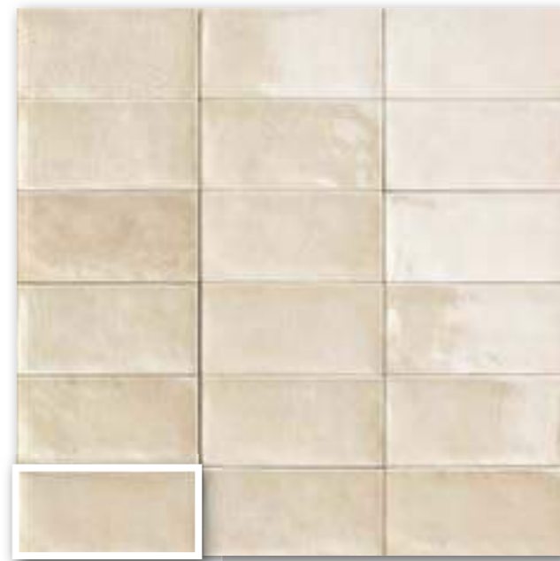
▲ CAMDEN BONE 10x20 (M-190) 4"x8"