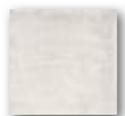
CALABRIA BLANCO 15x15 (M-152) 6"x6"