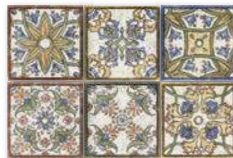
DECOR VIETRI 15x15 (M-220) 6"x6"