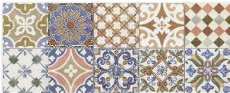
DECOR REGIONALE 15x15 (M-220) 6"x6"