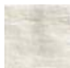
TUSCANIA WHITE 20x20 - 8"x8" (M-220)