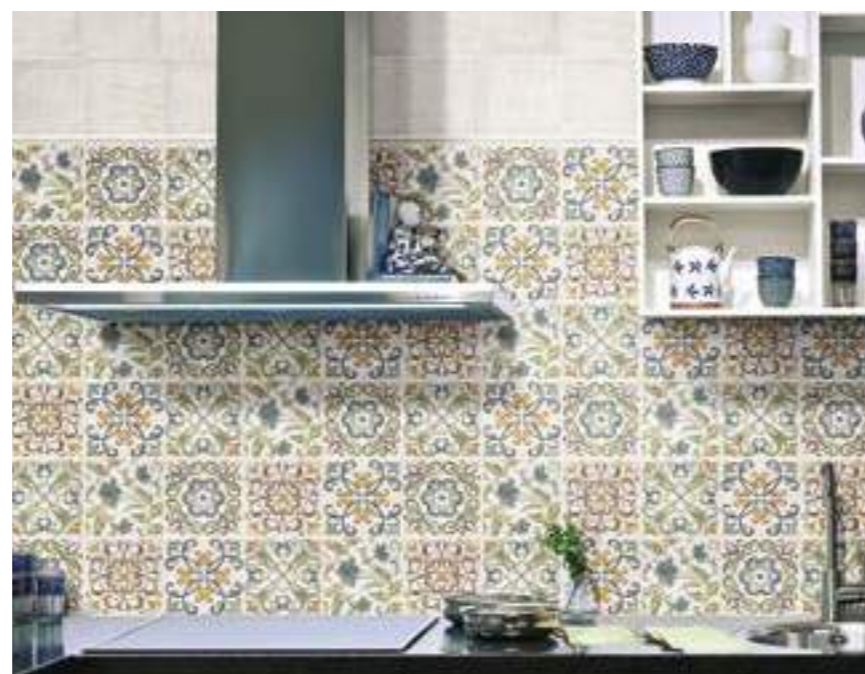
Decor Bámbole 15x15 · Calabria Blanco 15x15 · Torelo Calabria Blanco 2x15