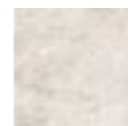
DUOMO BLANCO 20x20 - 8"x8" (M-220)

Ver serie completa en pág. 140 Check complete serie in page 140