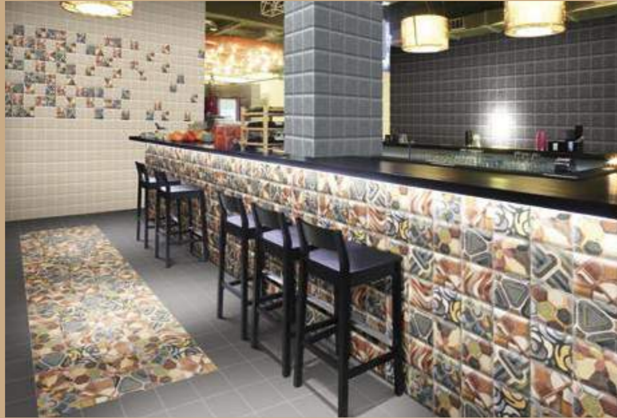
Bombato Beige 15x15 · Bombato Blu 15x15 · Bombato Grey 15x15 · Decor Tap Tap 15x15 · Pav. Tap Tap 20x20 · Victorian Gris 20x20