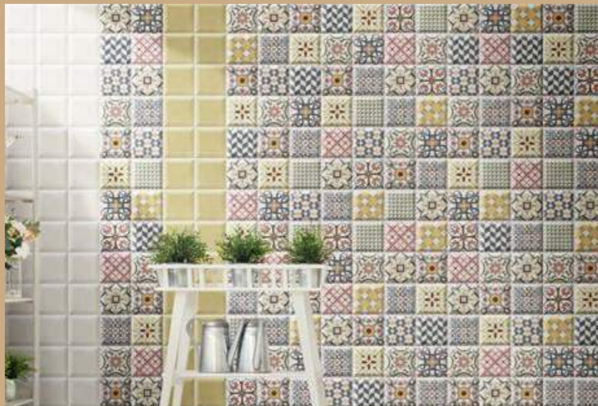
Bombato Blanco 15x15 · Bombato Green 15x15 · Decor Enzo 15x15