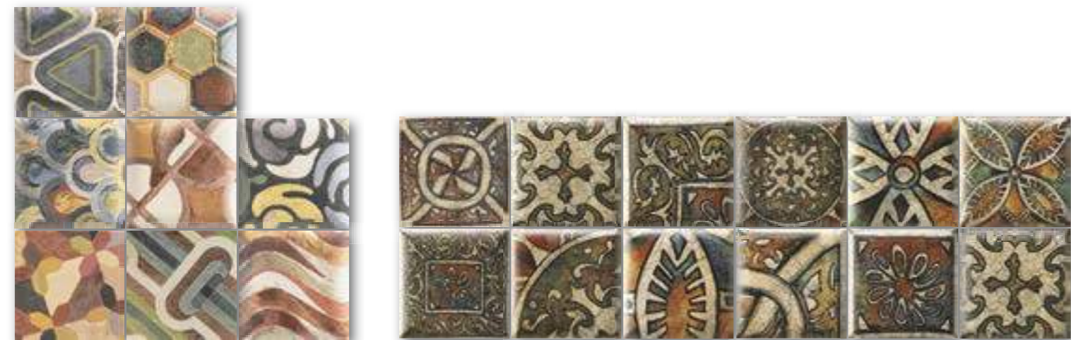
DECOR TAP TAP 15x15 (M-320) 6"x6" RANDOM Aleatorio DECOR DAVINCI 15x15 (M-320) 6"x6" RANDOM Aleatorio