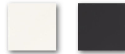
BLANCO MATE 15x15 (M-130) 6"x6" NEGRO MATE 15x15 (M-152) 6"x6"