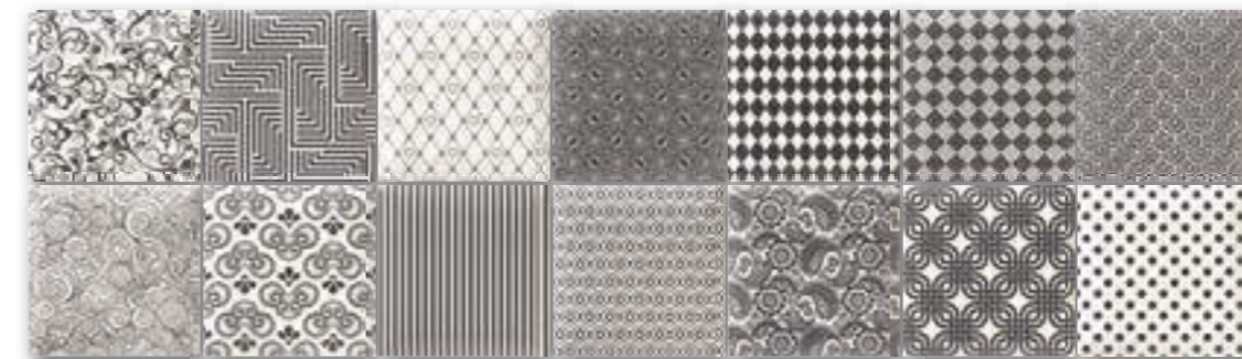
DECOR PRESTON 15x15 (M-320) 6"x6" RANDOM Aleatorio