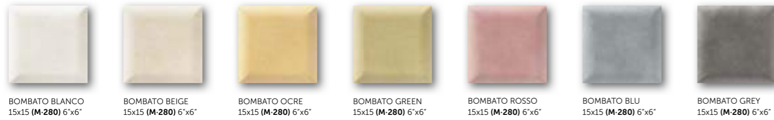
BOMBATO BLANCO 15x15 (M-280) 6"x6" BOMBATO BEIGE 15x15 (M-280) 6"x6" BOMBATO OCRE 15x15 (M-280) 6"x6" BOMBATO GREEN 15x15 (M-280) 6"x6" BOMBATO ROSSO 15x15 (M-280) 6"x6" BOMBATO BLU 15x15 (M-280) 6"x6" BOMBATO GREY 15x15 (M-280) 6"x6"