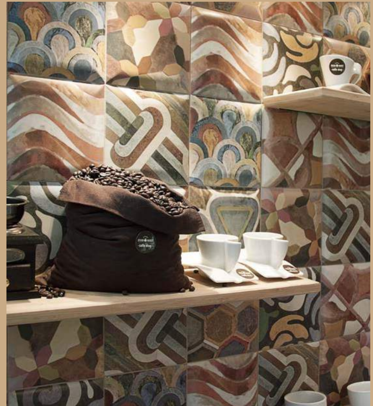
Decor Tap Tap 15x15