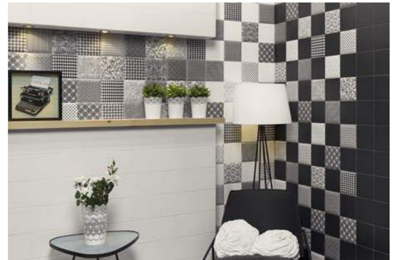
Blanco Mate 15x15 · Negro Mate 15x15 · Decor Preston 15x15