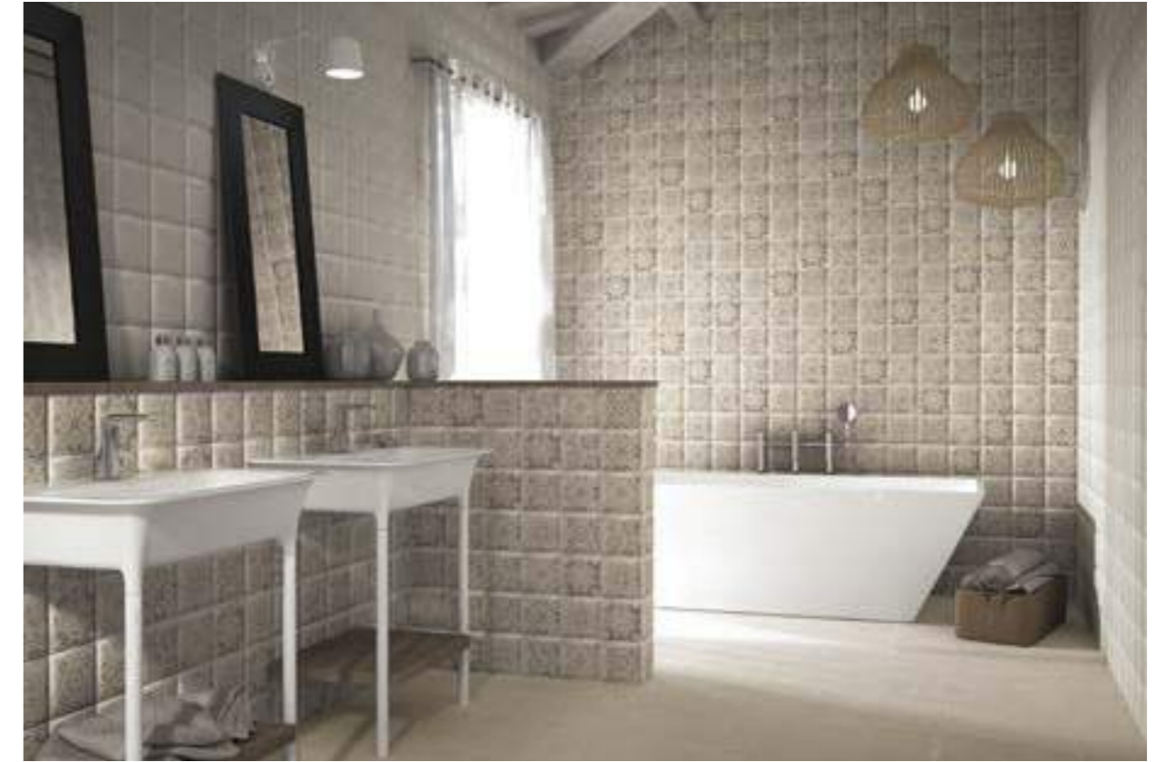
Bombato Beige 15x15 · Decor Derby 15x15 · Pav. Milano Blanco 20x20