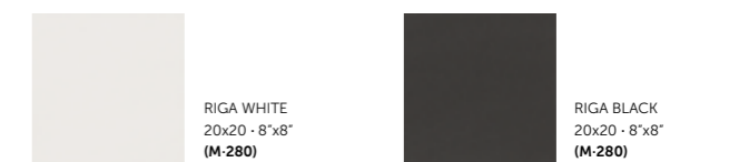
RIGA WHITE 20x20 - 8"x8" (M-280) RIGA BLACK 20x20 - 8"x8" (M-280)

Ver serie completa en pág. 160 Check complete serie in page 160