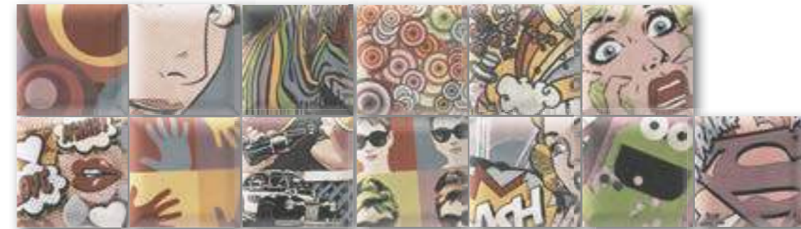
DECOR YORK 15x15 (M-320) 6"x6" RANDOM Aleatorio