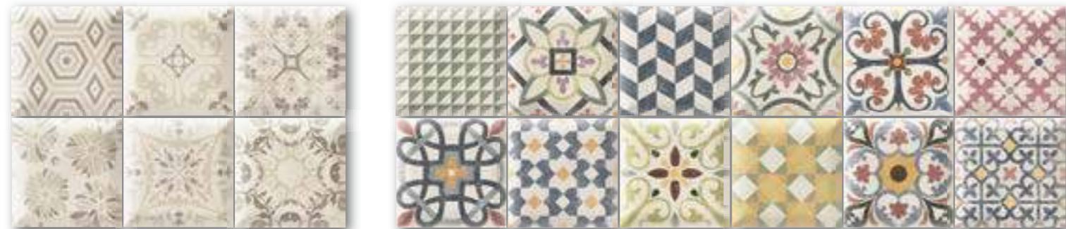
DECOR DERBY 15x15 (M-320) 6"x6" RANDOM Aleatorio DECOR ENZO 15x15 (M-320) 6"x6" RANDOM Aleatorio