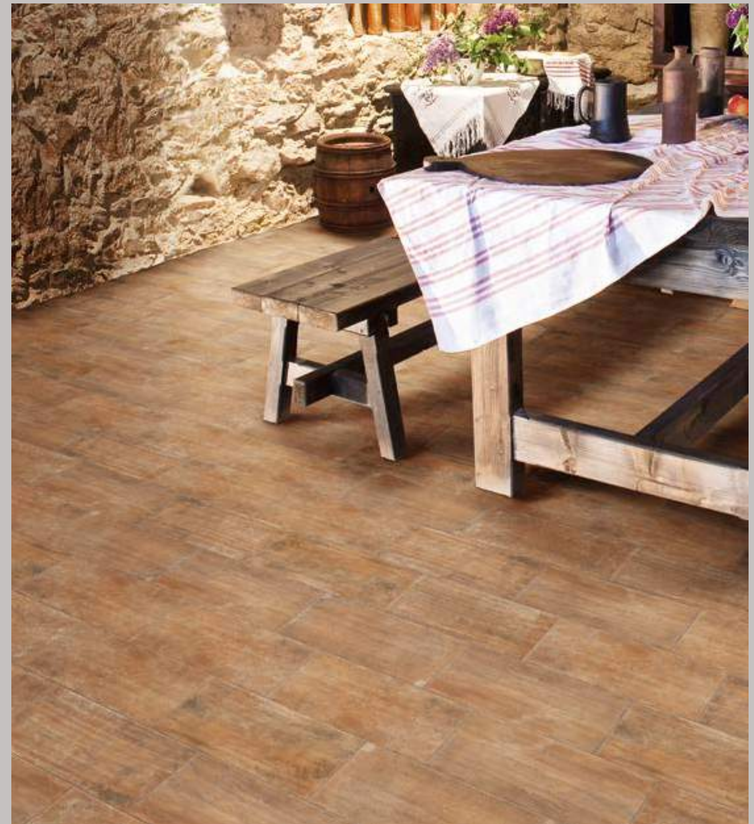
Aterra Cotto 15x30