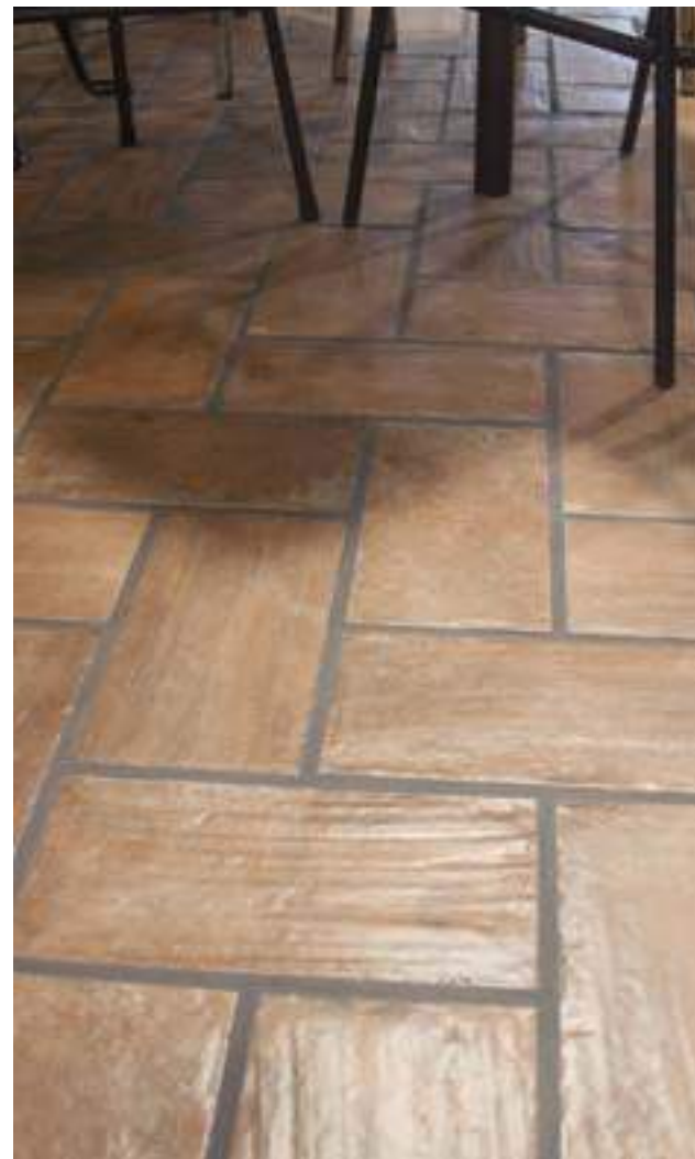
Aterra Cotto 15x30