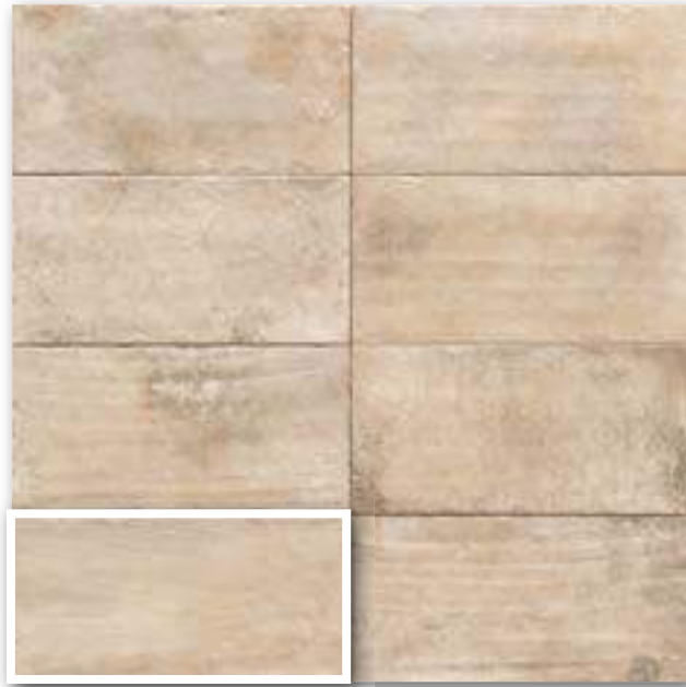
▲ ATERRA CREMA 15x30 (M-220) 6"x12"