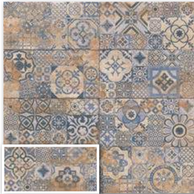
▲ DECOR ATERRA 15x30 (M-220) 6"x12"