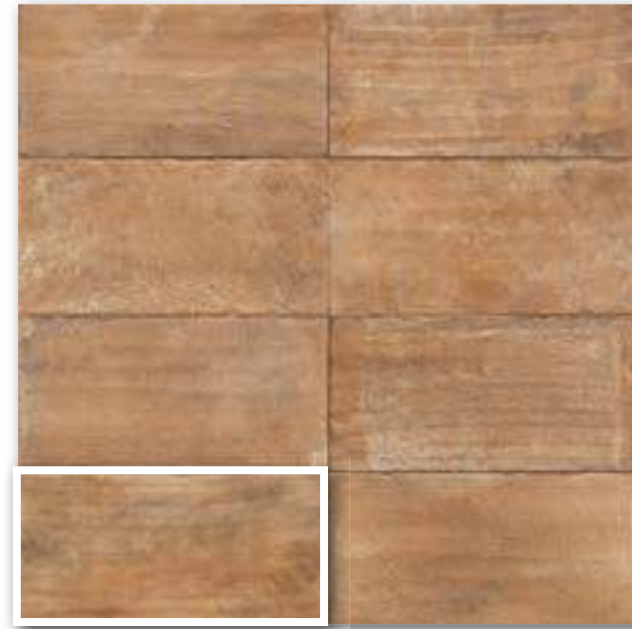
▲ ATERRA COTTO 15x30 (M-220) 6"x12"