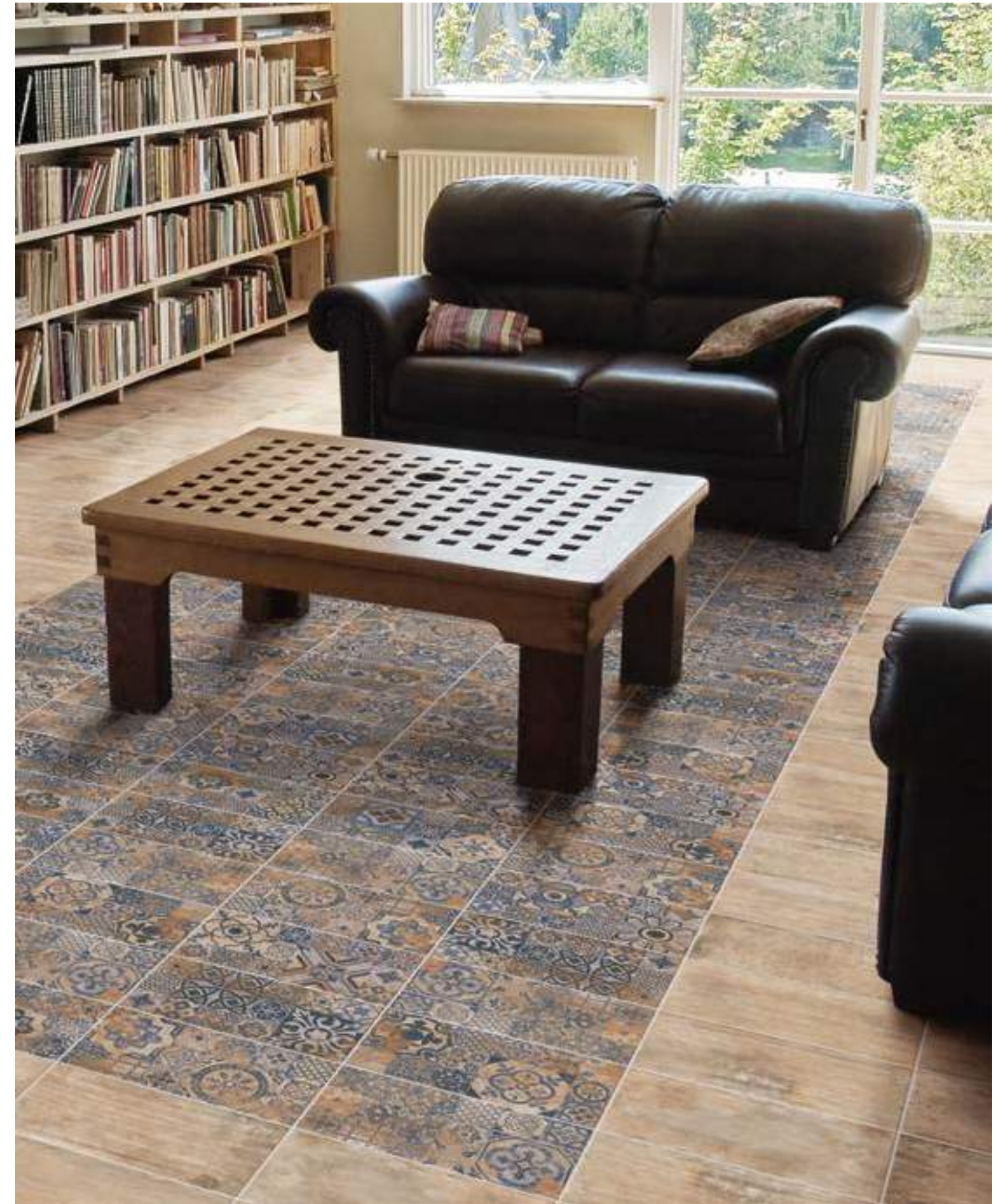
Aterra Crema 15x30 · Decor Aterra 15x30