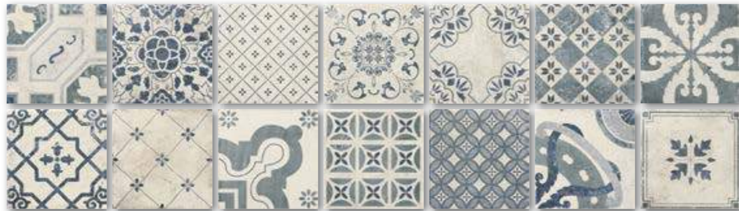
▲ PAV. ANTIQUA 20x20 (M-220) 8"x8"