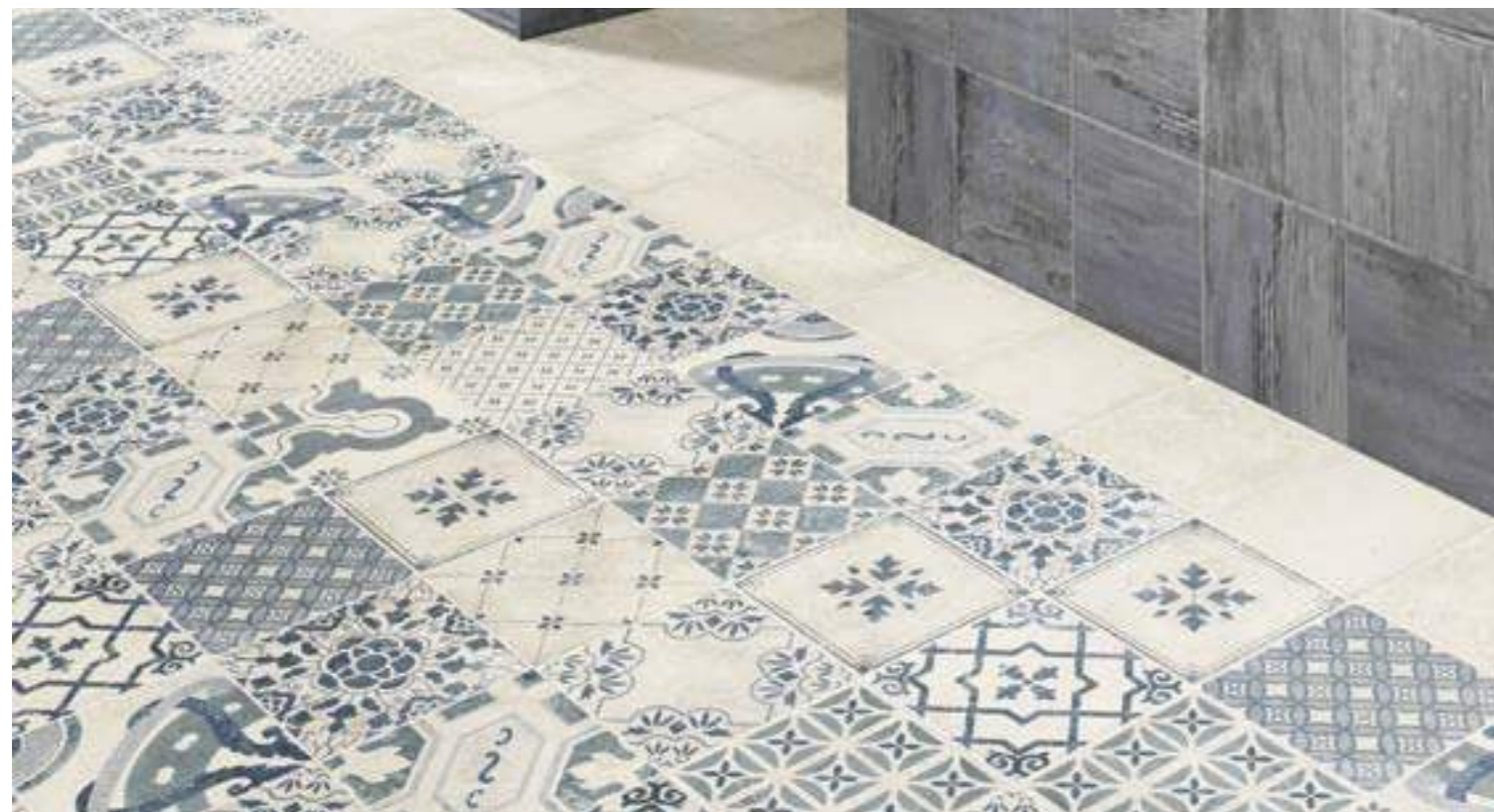
Pav. Milano Blanco 20x20 · Pav. Antiqua 20x20