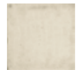
PAV. MILANO BLANCO 20x20 · 8"x8" (M-220)