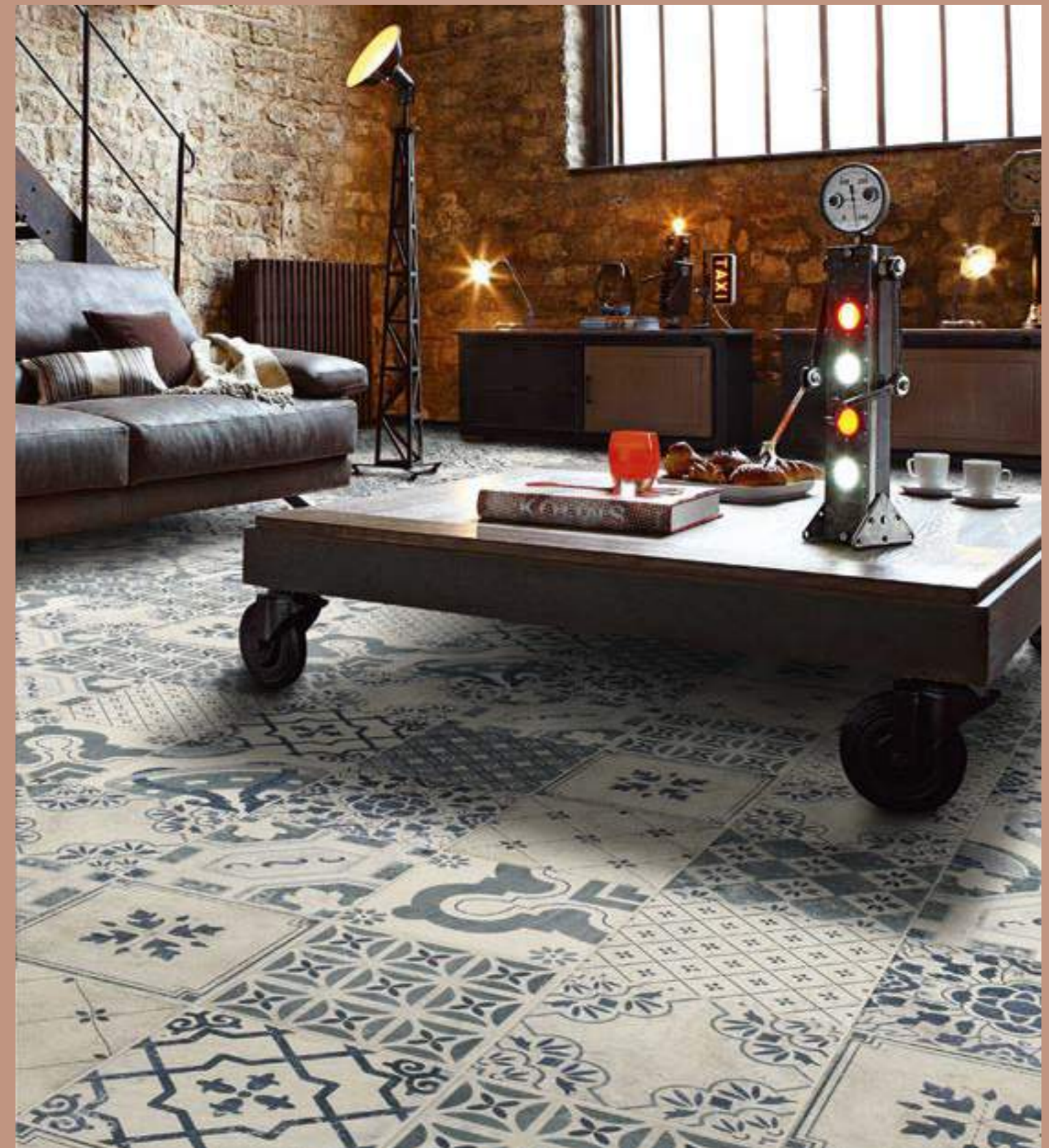
Pav. Antiqua 20x20