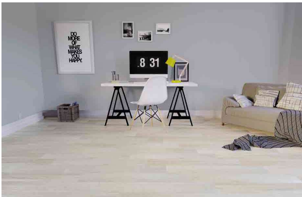
District Vainilla 15x90 cm. / 5,9x35,1" ▲

Porcelánico / Porcelain Tiles Pavimento y Revestimiento / Floor and Wall Tiles Mate / Matt