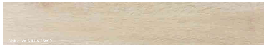
District VAINILLA 15x90

DISTINTAS GRÁFICAS empaquetadas de forma aleatoria.