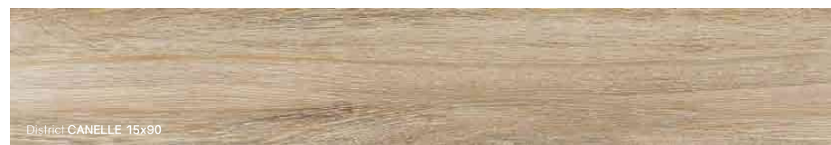
District CANELLE 15x90