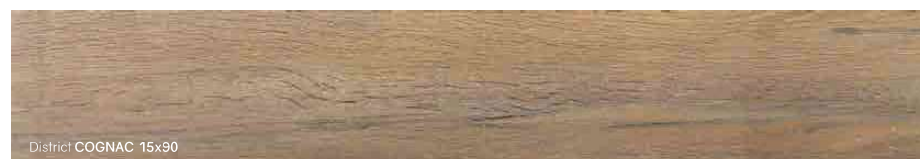
District COGNAC 15x90