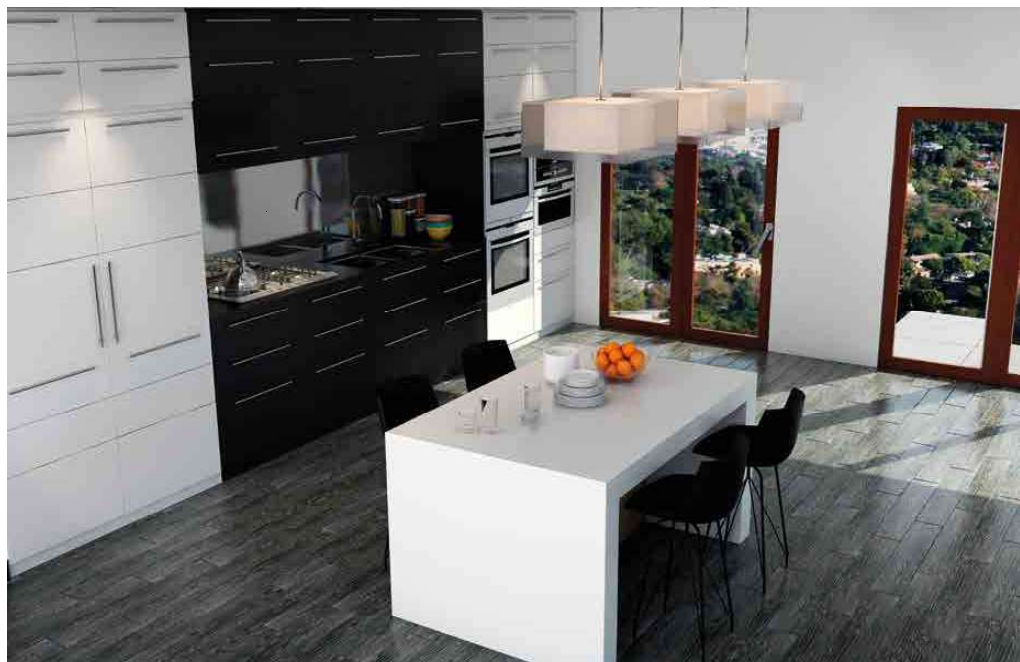
District Noir 15x90 cm. / 5,9x35,1" ▲

Porcelánico / Porcelain Tiles Pavimento y Revestimiento / Floor and Wall Tiles Mate / Matt