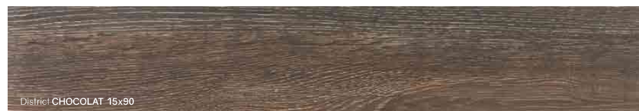
District CHOCOLAT 15x90