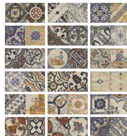
DECOR TREVISO 10x20 (M-220) 4"x8"