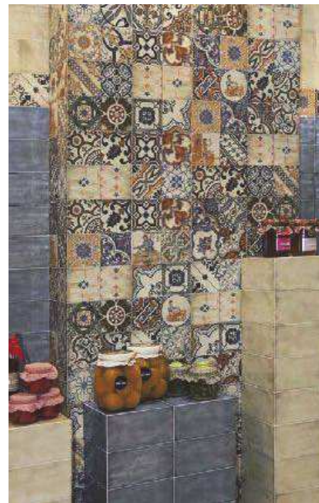
Treviso Blanco 10x20 - Treviso Cielo 10x20 - Decor Treviso 10x20