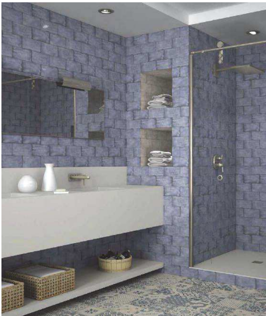
Treviso Cielo 10x20 - Pav. Antiqua 20x20