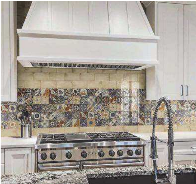
Treviso Blanco 10x20 - Decor Treviso 10x20

The Treviso serie presents a colour choice full of nuances which combine elegant, modern and traditional designs.