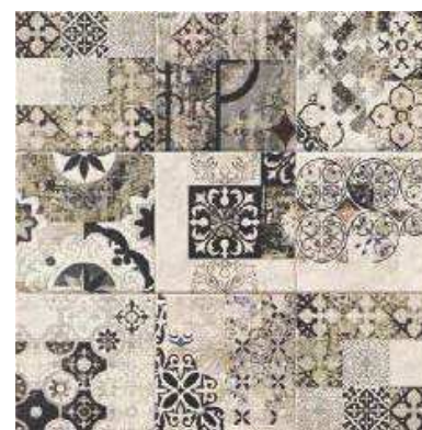
ART TITANIUM 20x20 (M-280) 8"x8"