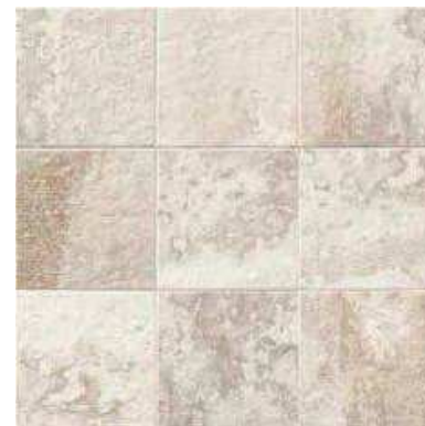
TITANIUM NATURAL 20x20 (M-130) 8"x8"