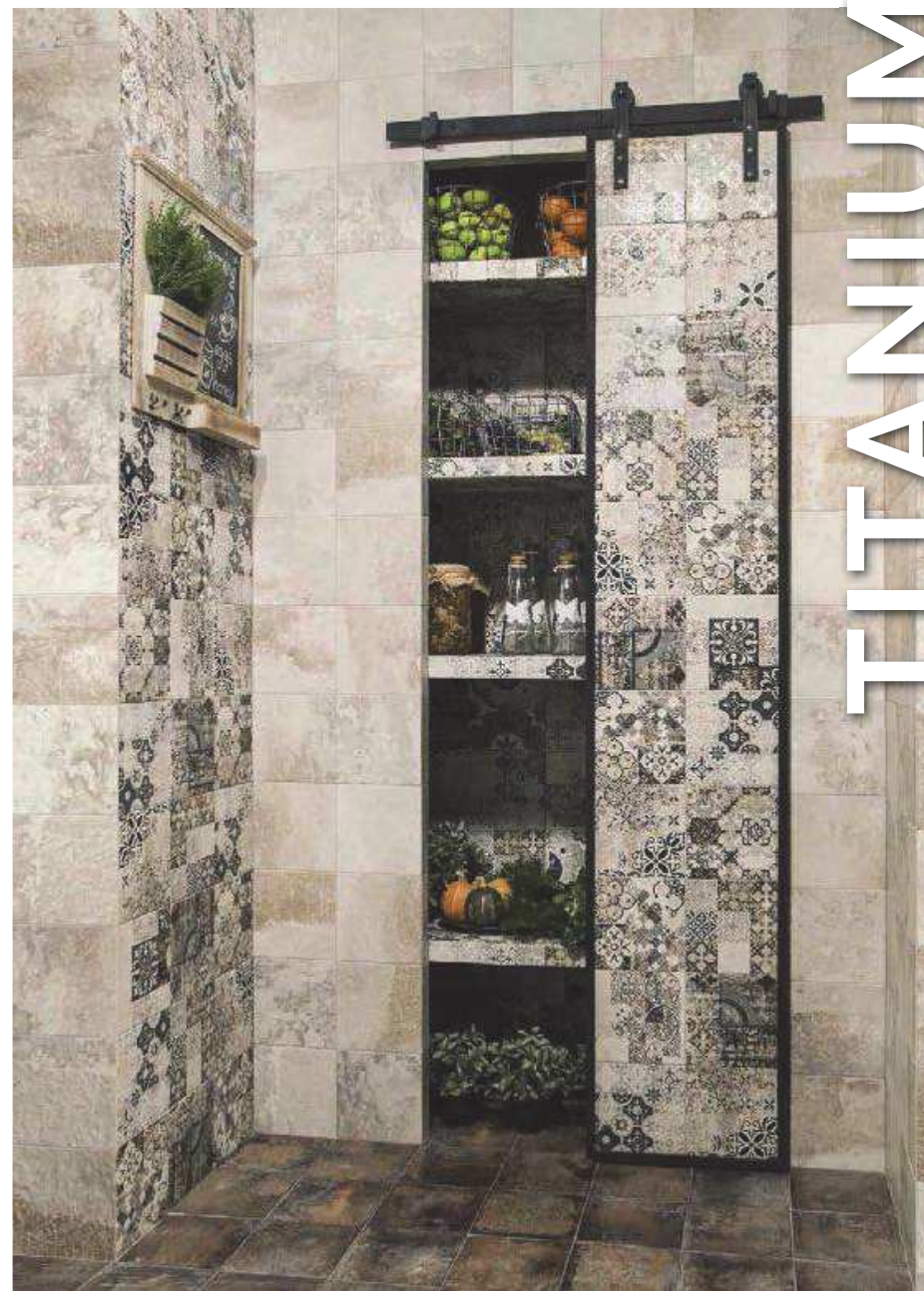
Titanium Natural 20x20 · Art Titanium 20x20 · Pav. Livorno Cotto 20x20