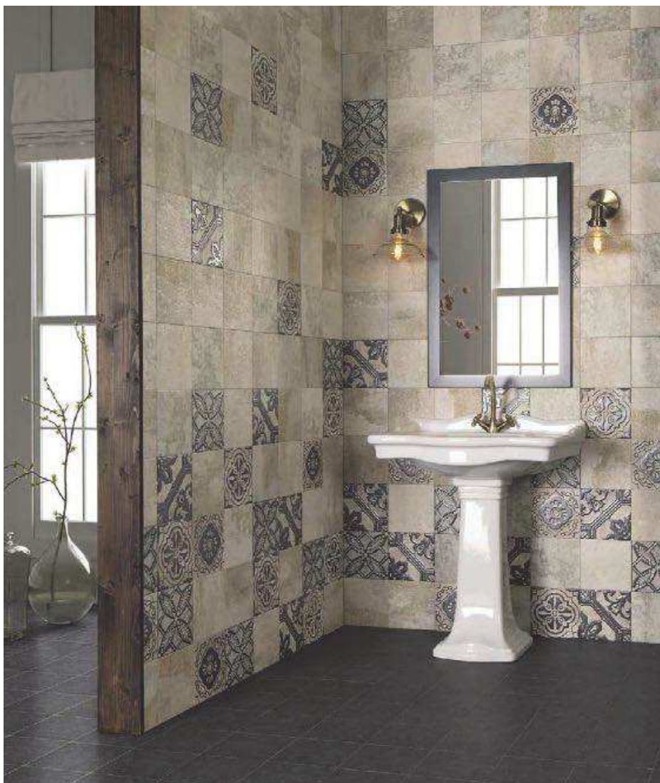
Titanium Natural 20x20 - Relief Titanium 20x20 - Pav. Victorian Gris 20x20