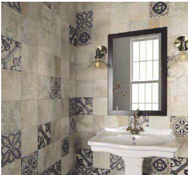
Titanium Natural 20x20 · Relief Titanium 20x20

EXTRACTED FROM NATURE Titanium is a collection inspired by stones extracted from the old mines. Graphic-rich colors and effects that imitate the mineral inlays of the original stones.