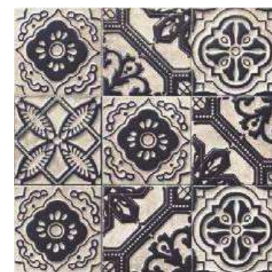
RELIEF TITANIUM 20x20 (M-350) 8"x8"

Ver serie completa en pág. 74 Check complete serie in page 74