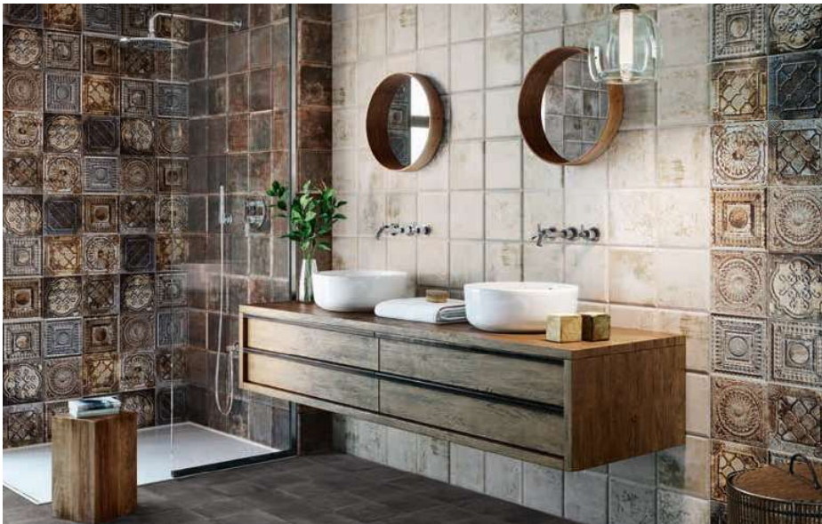
46 Tin-Tile Grey 20x20 · 8"x8" · Rusty Mix 20x20 · 8"x8" · Tin-Tile Nero 20x20 · 8"x8" Norland Black 20x20 · 8"x8" (Ver serie completa en / Check complete serie in PORCELAIN BOOK COLLECTIONS 2022 OPTYM)