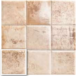
TIN-TILE CREAM 20x20 (M-130) 8"x8"