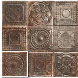
RUSTY NERO 20x20 (M-220) 8"x8"