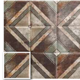
TIN-TILE DIAGONAL 20x20 (M-220) 8"x8"