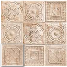
RUSTY CREAM 20x20 (M-220) 8"x8"