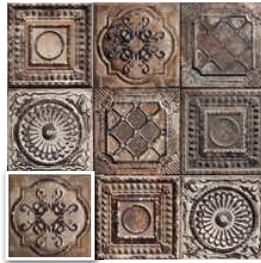
RUSTY MIX 20x20 (M-280) 8"x8"