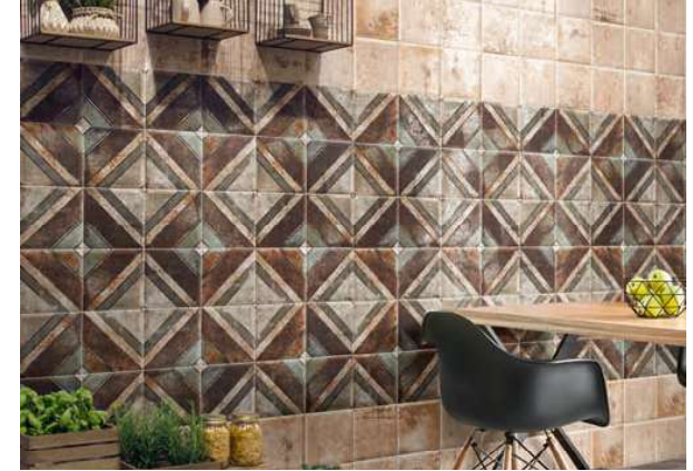
Tin-Tile Cream 20x20 · 8"x8" · Tin-Tile Diagonal 20x20 · 8"x8"