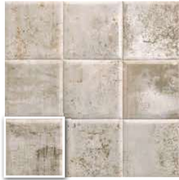
TIN-TILE GREY 20x20 (M-130) 8"x8"