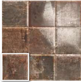
TIN-TILE NERO 20x20 (M-130) 8"x8"