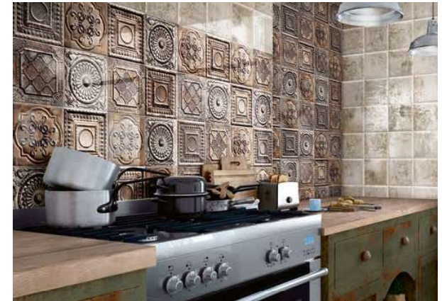
Tin-Tile Grey 20x20 · 8"x8" · Rusty Mix 20x20 · 8"x8"