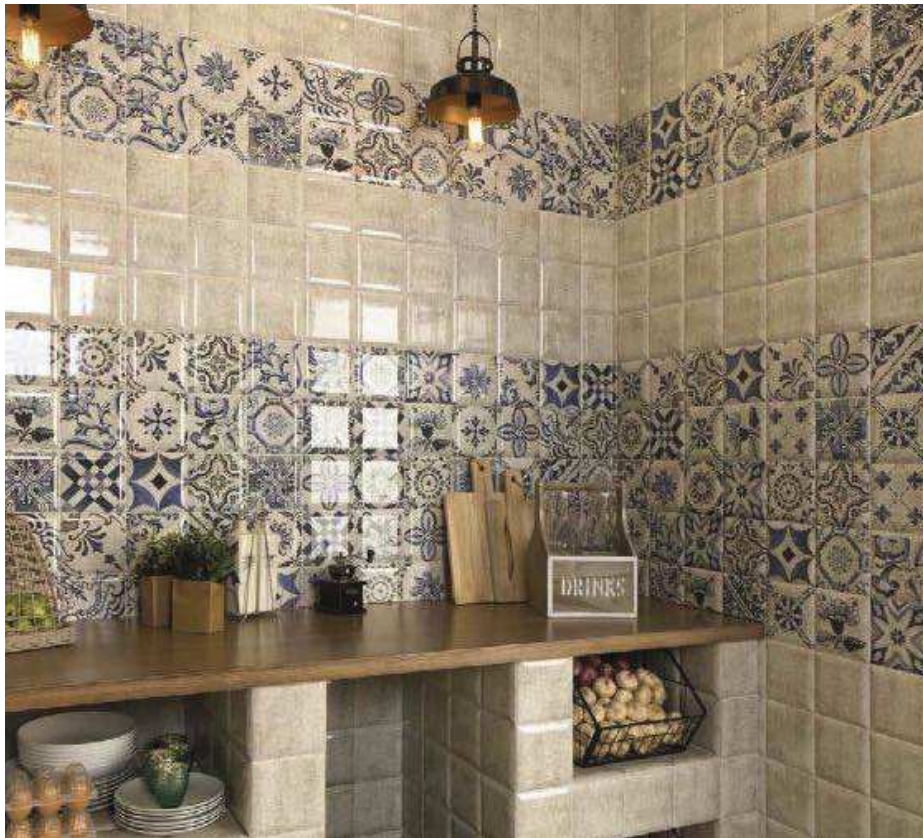
Tavira Blanco 15x15 - Decor Tavira 15x15