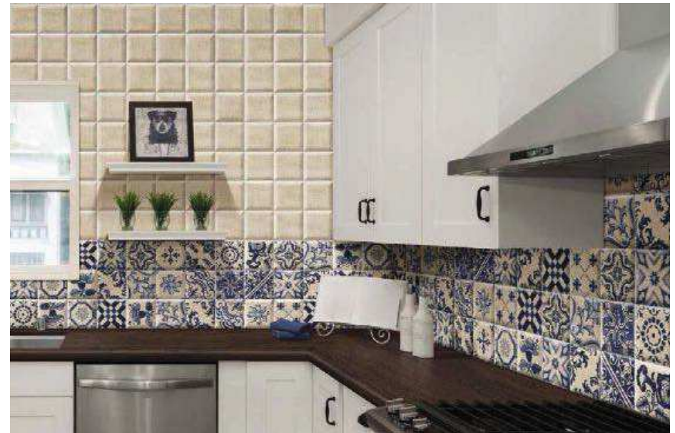
Tavira Blanco 15x15 - Decor Tavira 15x15