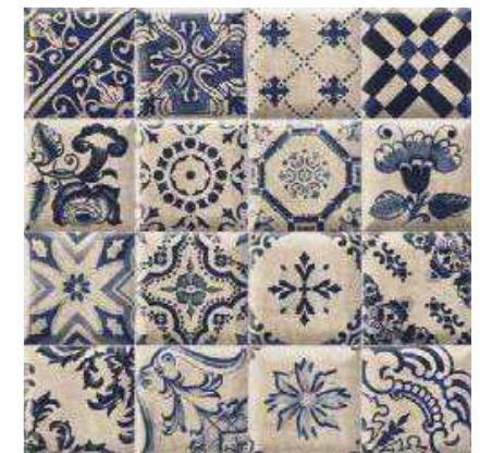
DECOR TAVIRA 15x15 (M-320) 6"x6"