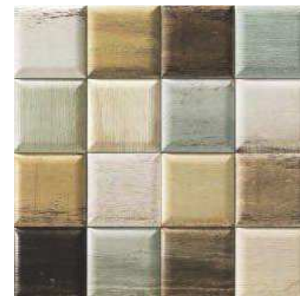
SOHOMIX 15x15 (M-280) 6"x6"