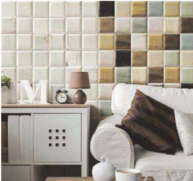
Soho Blanco 15x15 - Soho Mix 15x15

The Soho serie dares to give vintage colours to the wood. Light tones to achieve a worn down but modern look.