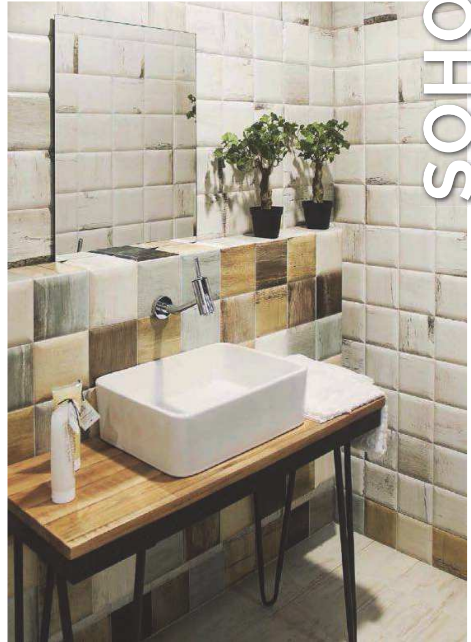
Soho Blanco 15x15 - Soho Mix 15x15 - Pav. Pacifico Blanco 15x30