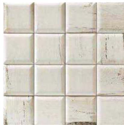
SOHO BLANCO 15x15 (M-280) 6"x6"