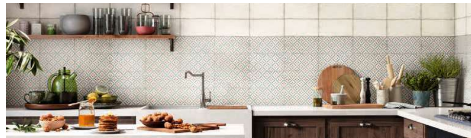
Rivoli White 15x30 · 6"x12" · Saboya 15x30 · 6"x12"