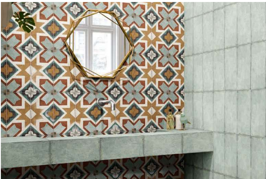
Rivoli Blu 15x30 · 6"x12" · Rivalta 15x30 · 6"x12"