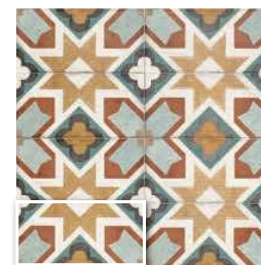
RIVALTA 15x30 (M 220) 6"x12"