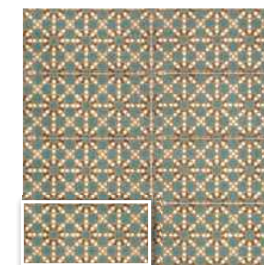
LUSERNA 15x30 (M 220) 6"x12"