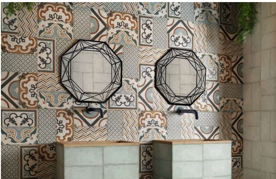
Rivoli White 15x30 · 6"x12" · Rivoli Blu 15x30 · 6"x12" · Torino 15x30 · 6"x12"