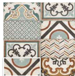
TORINO 15x30 (M 220) 6"x12"