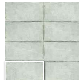
RIVOLI BLU 15x30 (M 152) 6"x12"