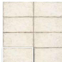
RIVOLI WHITE 15x30 (M 152) 6"x12"