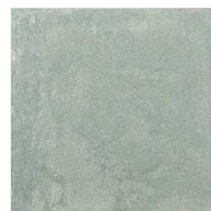
MZ20CAR-MEN Carino Menta Green 20x20 MZ-280