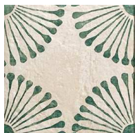
MZ20PALMA Carino Deco Palma 20x20 MZ-280