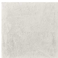
MZ20INDIGO Carino Pearl 20x20 MZ-280