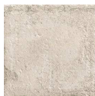
MZ20NORLA-W Norland White 20x20 MZ-280