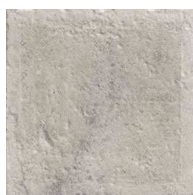
MZ20NORLA-G Norland Grey 20x20 MZ-280