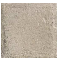
MZ20NORLA-BE Norland Beige 20x20 MZ-280