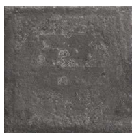
MZ20NORLA-BK Norland Black 20x20 MZ-280