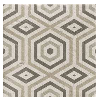
MZ20OSLO Oslo 20x20 MZ-280