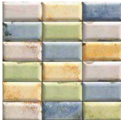
MISSOURI MIX 10x20 (M-280) 4"x8"