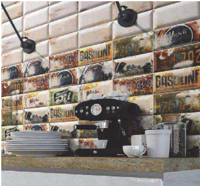
Missouri White 10x20 - Decor Missouri 10x20