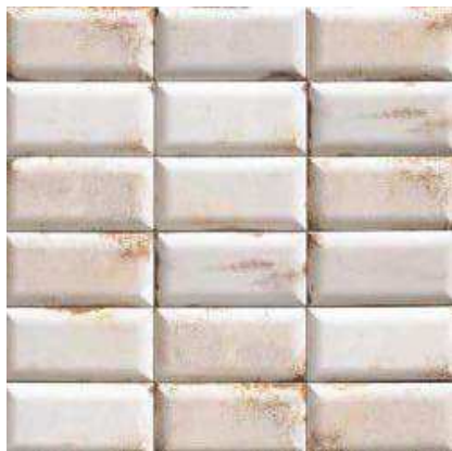
MISSOURI WHITE 10x20 (M-280) 4"x8"