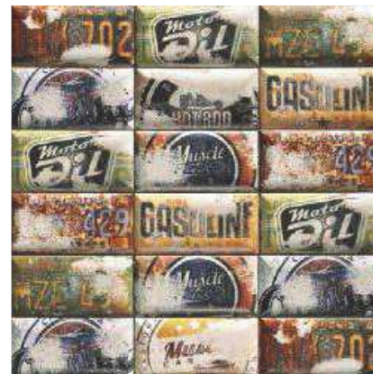
DECOR MISSOURI 10x20 (M-320) 4"x8"