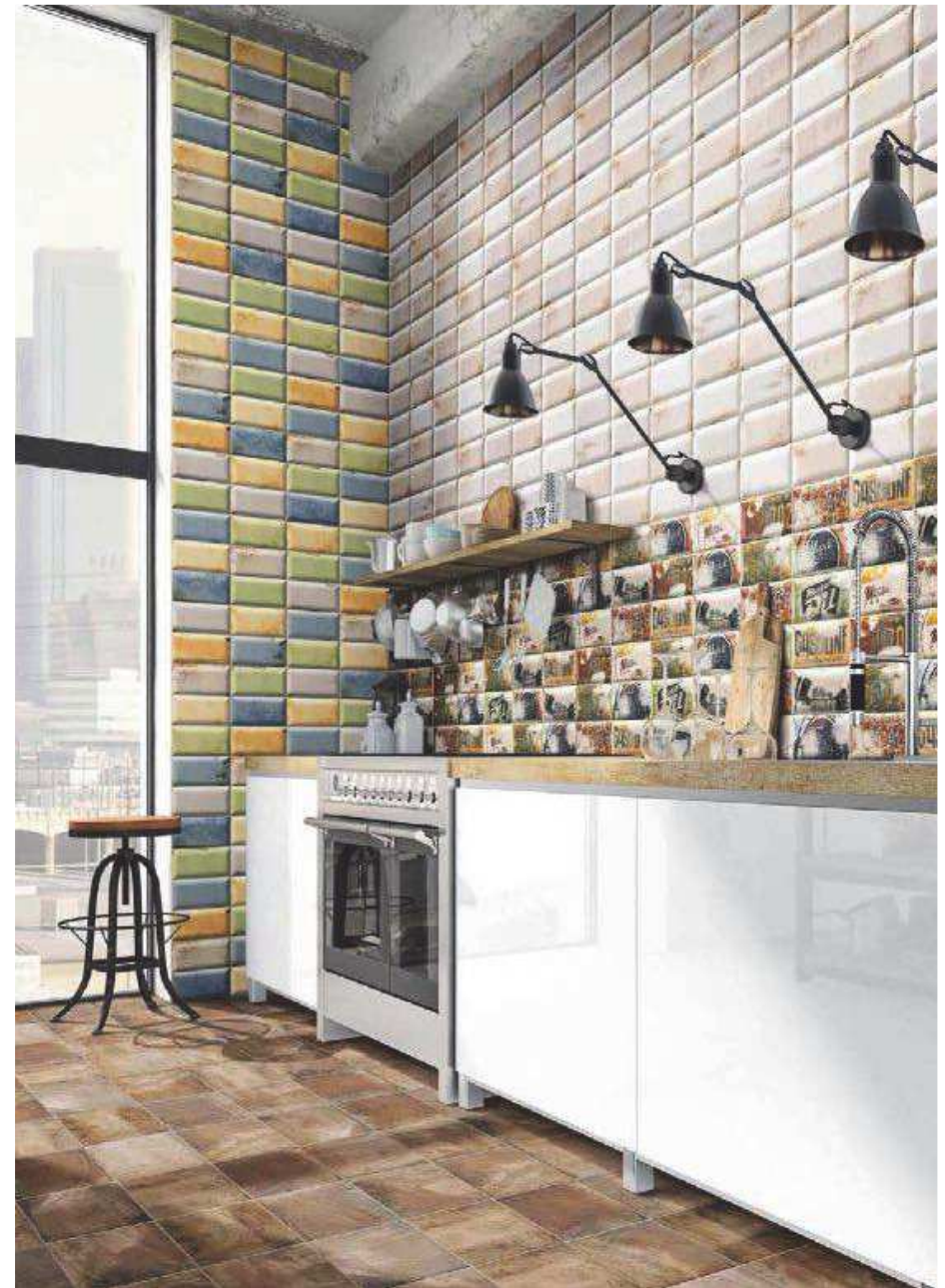
Missouri White 10x20 - Missouri Mix 10x20 - Decor Missouri 10x20 - Pav. Forti Cotto 20x20