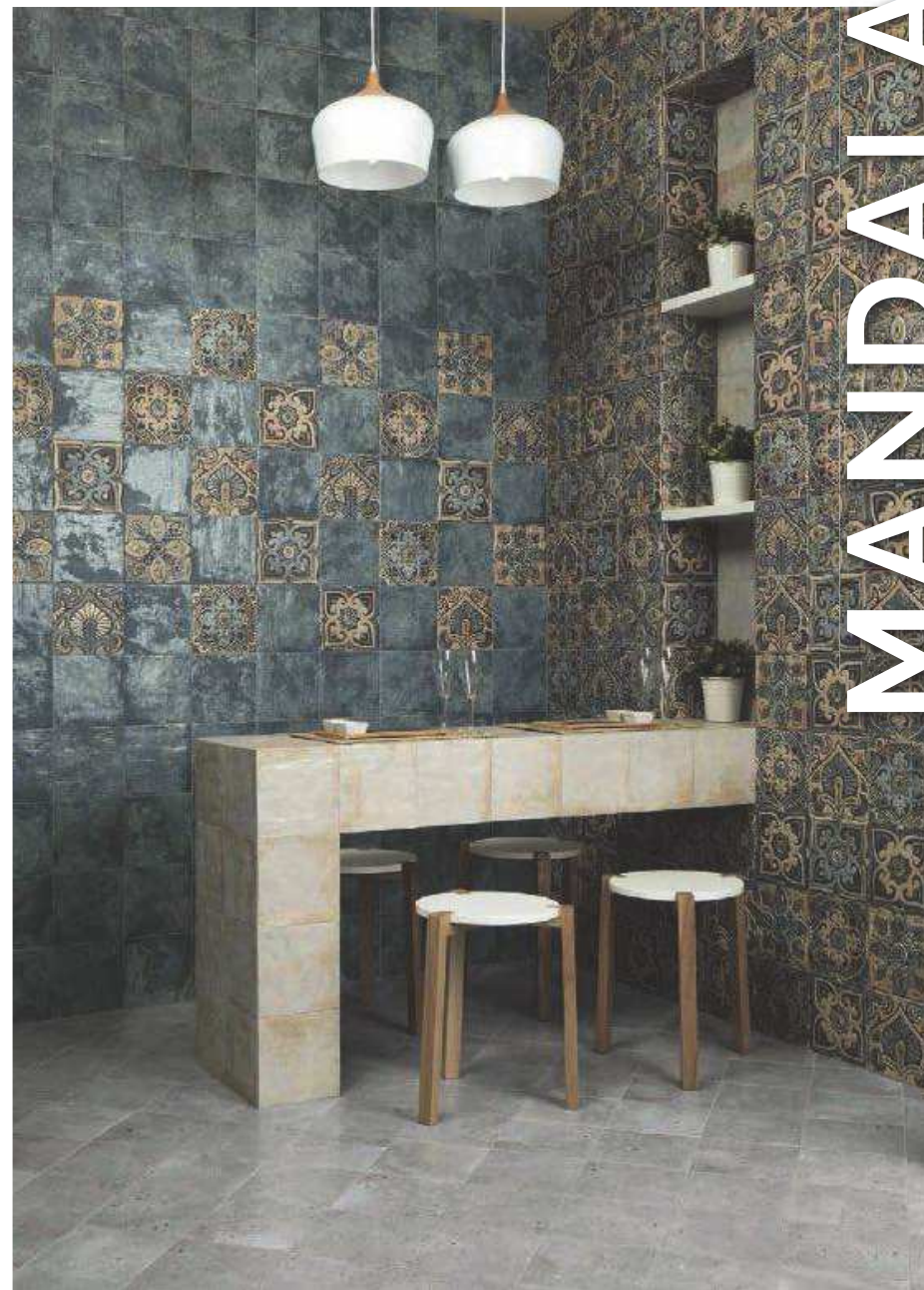
Mandala White 20x20 - Mandala Green 20x20 - Centro Mandala 20x20 - Pav. Colombina Grey 20x20