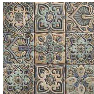
CENTRO MANDALA 20x20 (M-320) 8"x8"