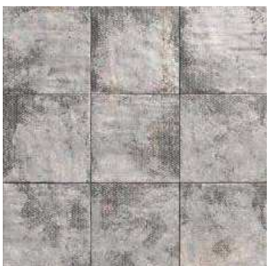
MANDALA GREY 20x20 (M-152) 8"x8"