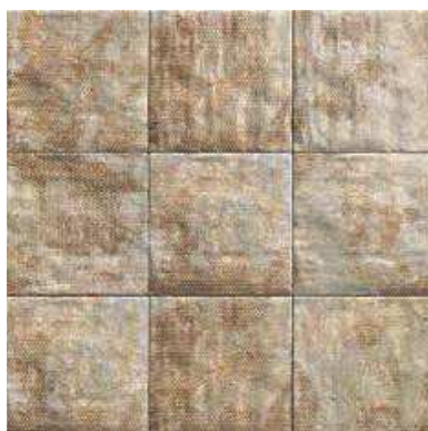
MANDALA BROWN 20x20 (M-152) 8"x8"