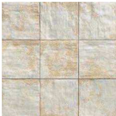
MANDALA WHITE 20x20 (M-152) 8"x8"