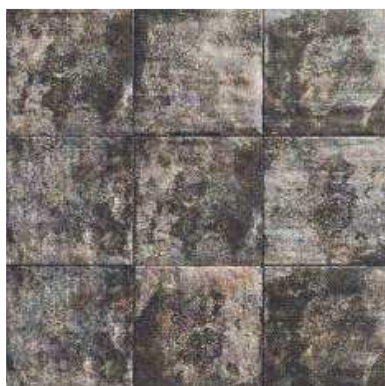
MANDALA BLACK 20x20 (M-152) 8"x8"