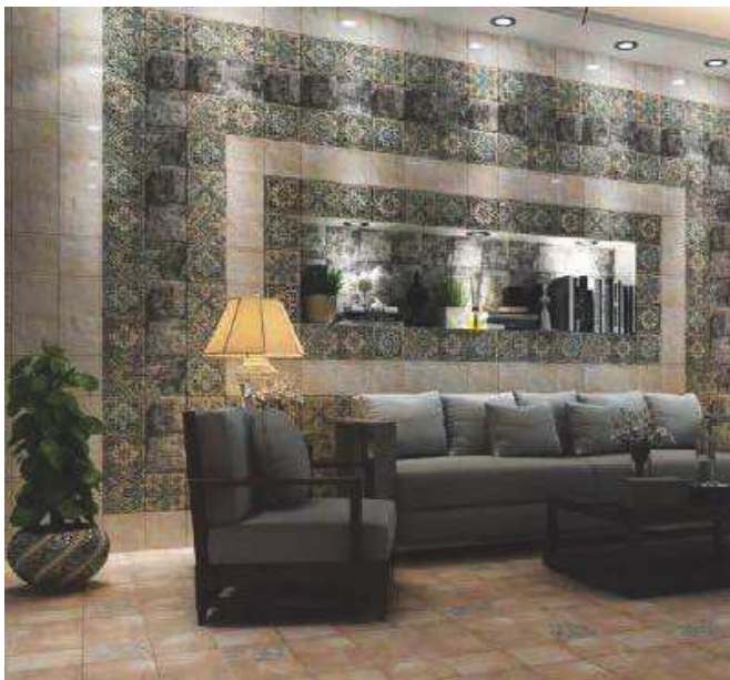
Mandala White 20x20 - Mandala Black 20x20 - Centro Mandala 20x20 - Pav. Forti Cream 20x20

MIX & MATCH Mixing and combining styles, boosting the creativity of every space. Joining together imagination and knowledge of last trends in interior designing. Wall tiles full of volumes that would not leave you indifferent.