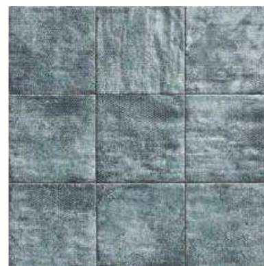
MANDALA GREEN 20x20 (M-152) 8"x8"