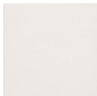
MZ20RIGA-W Riga White 20x20 MZ-280