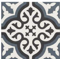
MZ20LONDON London 20x20 MZ-280