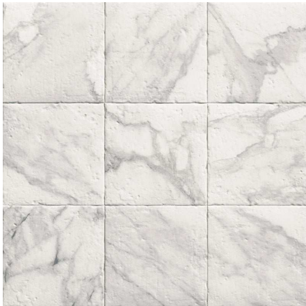
MZ20HERMITA-L Hermitage Light 20x20 MZ-280