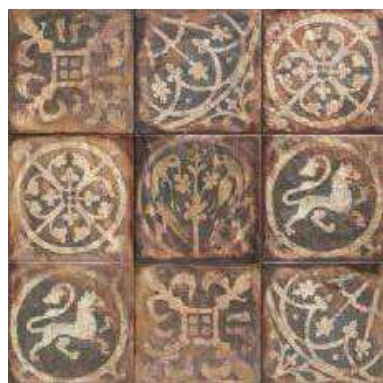
LOMBA 20x20 (M-220) 8"x8"