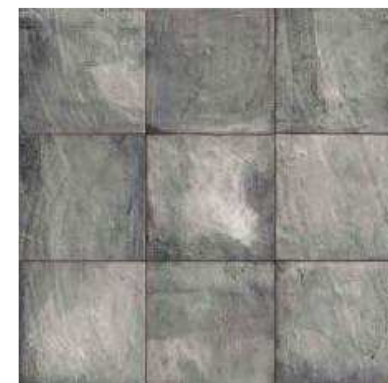
FORLI GREY 20x20 (M-220) 8"x8"