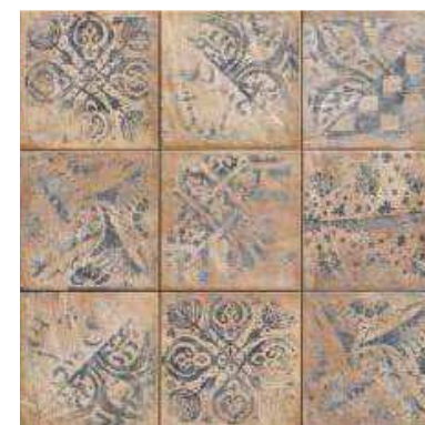
VISCONTI 20x20 (M-220) 8"x8"