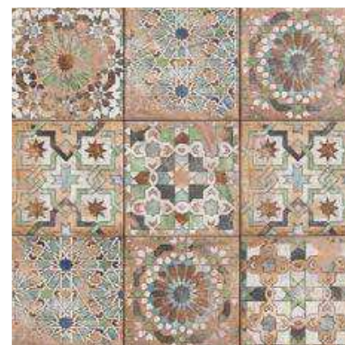
SFORZA 20x20 (M-220) 8"x8"