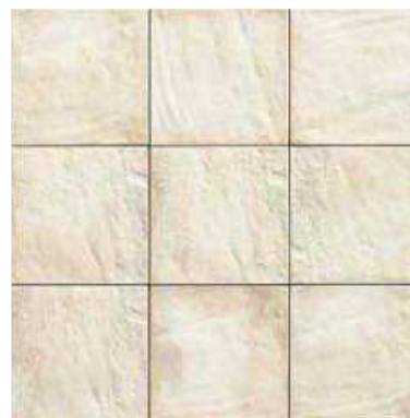
FORLI WHITE 20x20 (M-220) 8"x8"