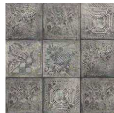
BORGHESE 20x20 (M-220) 8"x8"