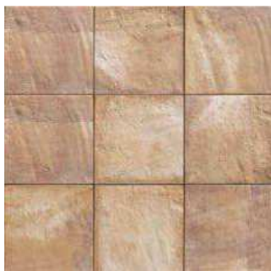
FORLÌ CREAM 20x20 (M-220) 8"x8"