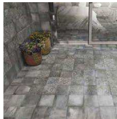
Forli Grey 20x20 - Borghese 20x20