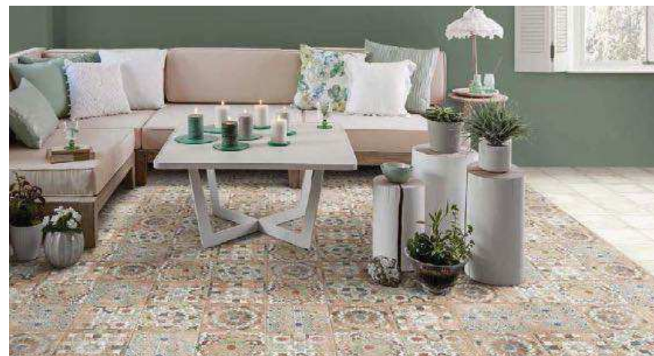
Forli White 20x20 - Sforza 20x20