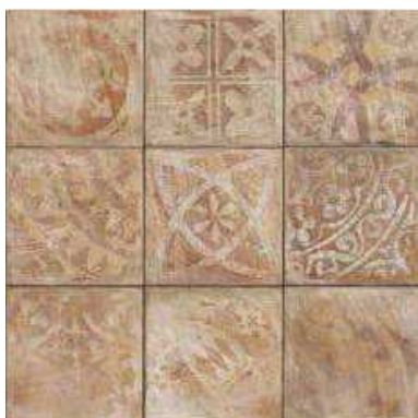
TEANO 20x20 (M-220) 8"x8"