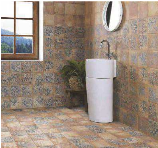
Forli Cream 20x20 - Visconti 20x20

The antique style is fashionable again. The search of being singular encourages the interest in the past. Nowadays, people are seduced by worn out shapes and vivid colours like the one we find in the clay.