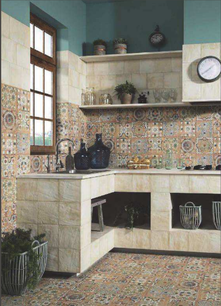
Forli White 20x20 - Storza 20x20