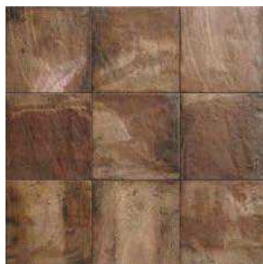
FORLÌ COTTO 20x20 (M-220) 8"x8"