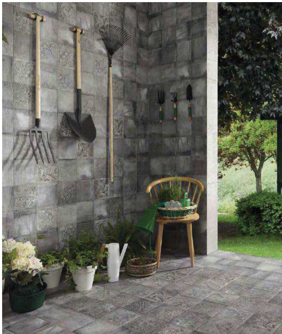
Forli Grey 20x20 - Borghese 20x20