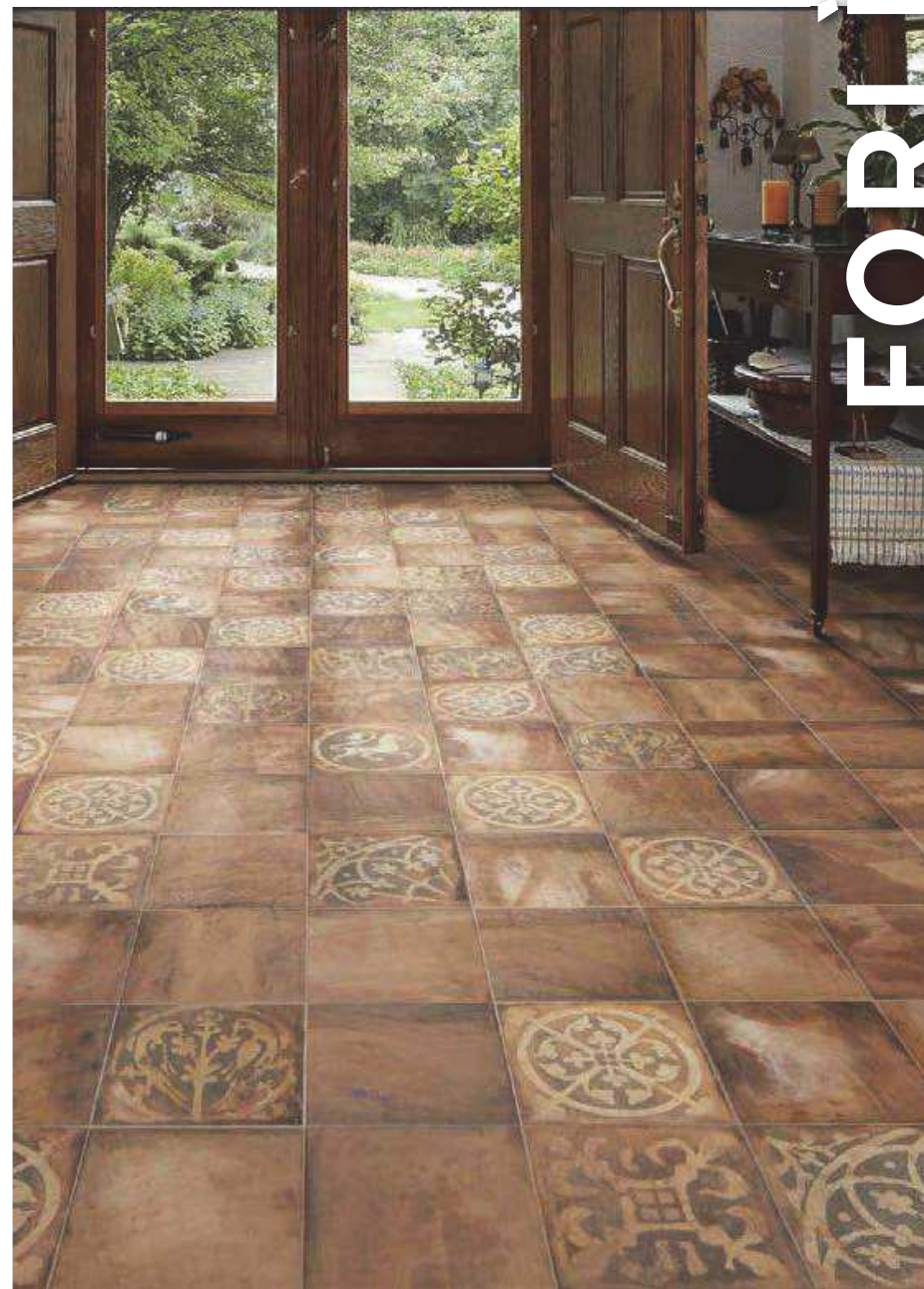
Forli Cotto 20x20 - Lomba 20x20