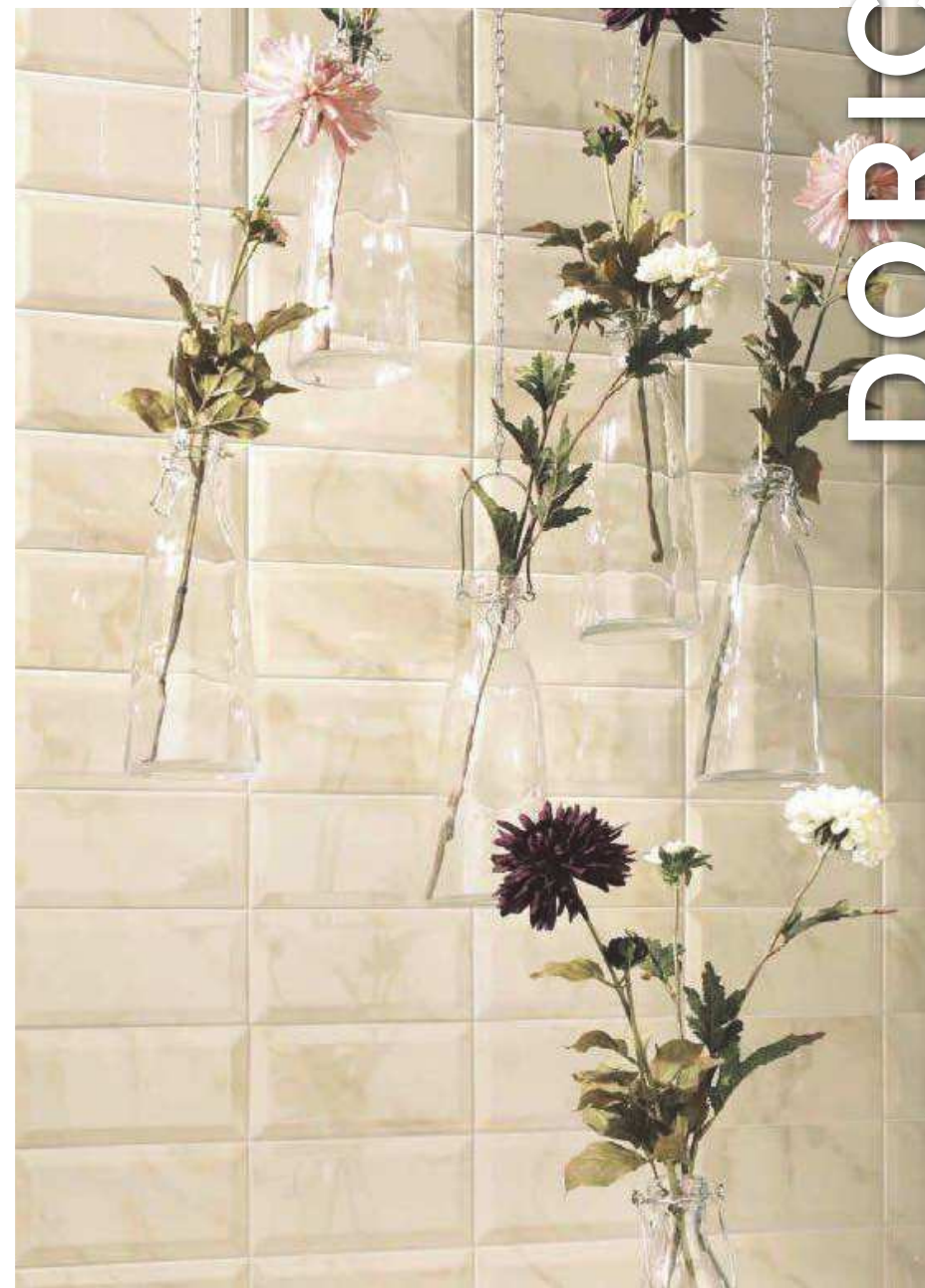
Doric Crema 10x20