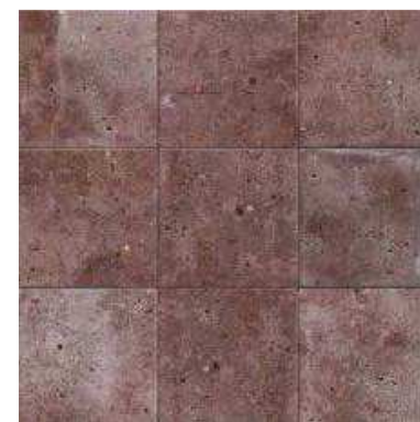
COLOMBINA PURPLE 20x20 (M-220) 8"x8"