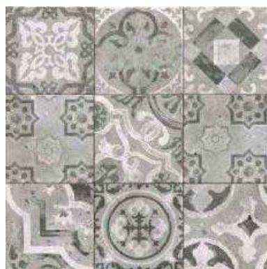
SERENA GREY 20x20 (M-220) 8"x8"