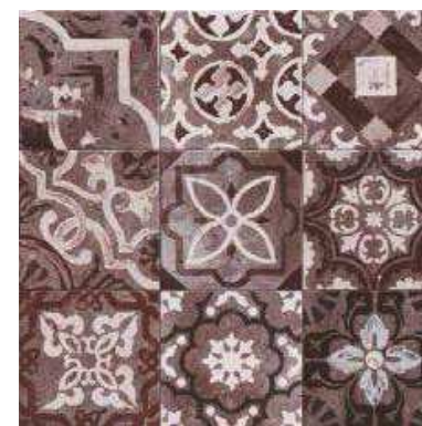
SERENA PURPLE 20x20 (M-220) 8"x8"