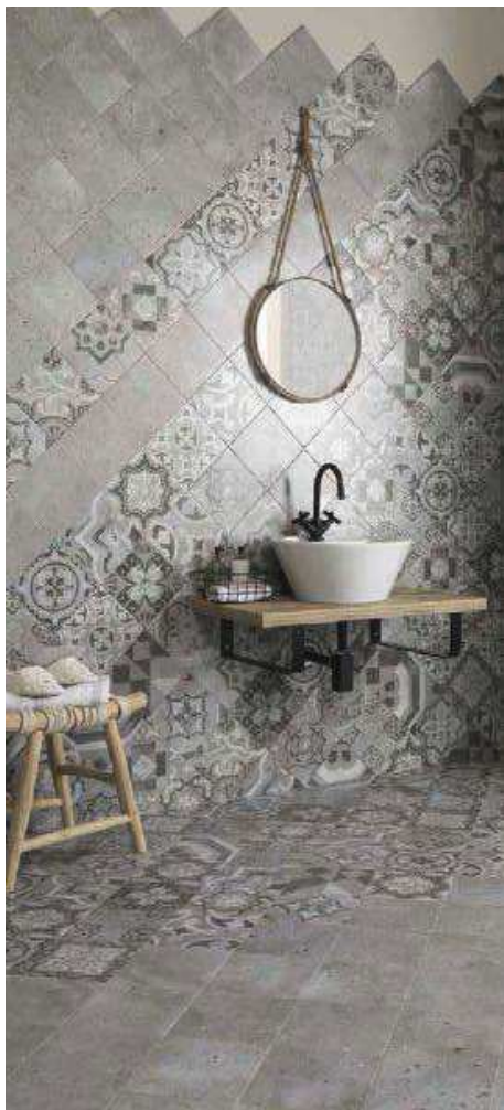
Colombina Grey 20x20 · Serena Grey 20x20