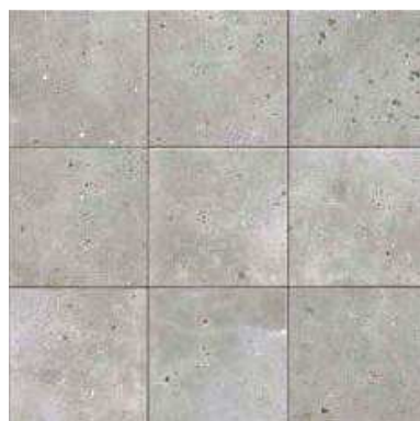
COLOMBINA GREY 20x20 (M-220) 8"x8"