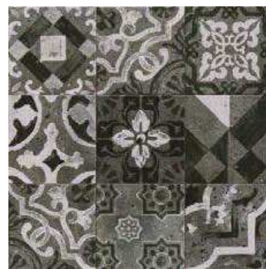
SERENA BLACK 20x20 (M-220) 8"x8"