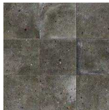
COLOMBINA BLACK 20x20 (M-220) 8"x8"