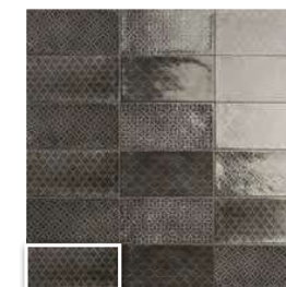
DECOR CAMDEN NERO 10x20 (M 220) 4"x8"