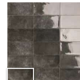
CAMDEN NERO 10x20 (M 190) 4"x8"