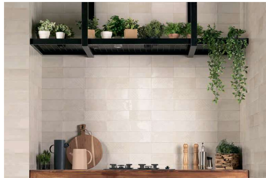
Camden Bianco 10x20 · 4"x8" · Decor Camden Bianco 10x20 · 4"x8"