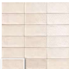
DECOR CAMDEN BIANCO 10x20 (M 220) 4"x8"