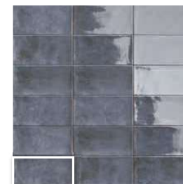
CAMDEN AZURRO 10x20 (M 190) 4"x8"