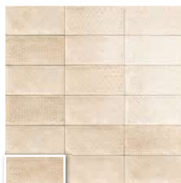
DECOR CAMDEN BONE 10x20 (M 220) 4"x8"