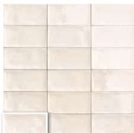
CAMDEN BIANCO 10x20 (M 190) 4"x8"