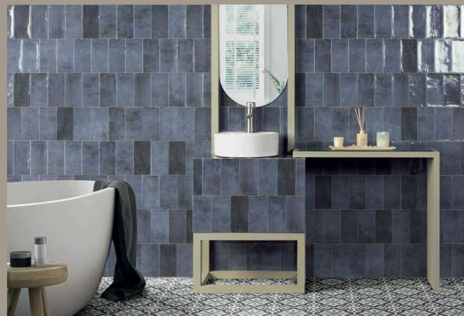
Camden Azurro 10x20 · 4"x8" · London 20x20 · 8"x8" (Ver serie completa en / Check complete serie in PORCELAIN BOOK COLLECTIONS 2022 OPTYM) 105