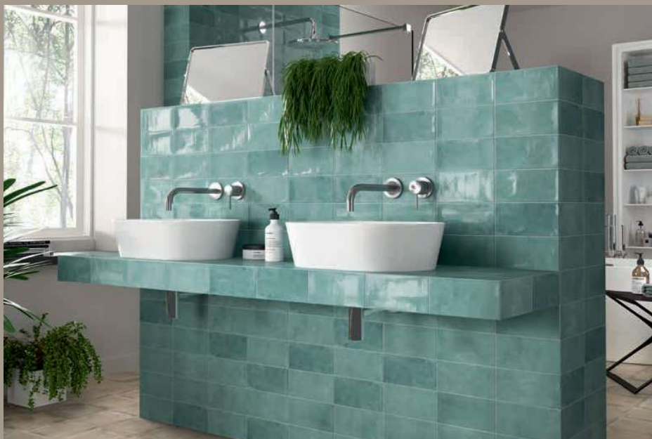
106 Camden Emerald 10x20 · 4"x8" Norland Beige 20x20 · 8"x8" (Ver serie completa en / Check complete serie in PORCELAIN BOOK COLLECTIONS 2022 OPTYM)