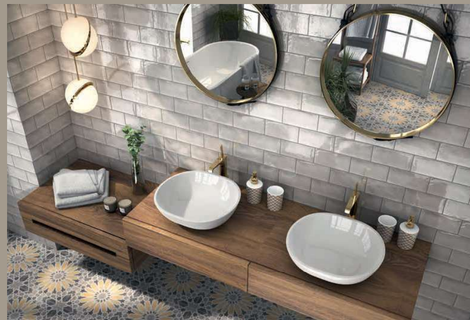
Camden Grey 10x20 · 4"x8" · Quadix 20x20 · 8"x8" (Ver serie completa en / Check complete serie in PORCELAIN BOOK COLLECTIONS 2022 OPTYM)