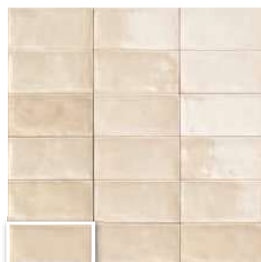
CAMDEN BONE 10x20 (M 190) 4"x8"