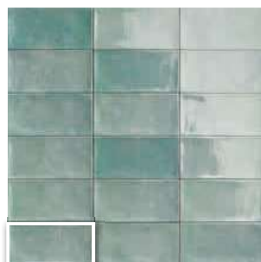
CAMDEN EMERALD 10x20 (M 190) 4"x8"