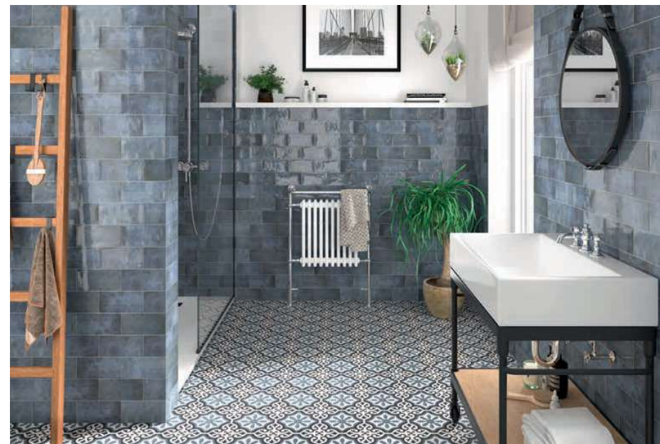
Camden Azzurro 10x20 · 4"x8" · London 20x20 · 8"x8" (Ver serie completa en / Check complete serie in PORCELAIN BOOK COLLECTIONS 2022 OPTYM) 107