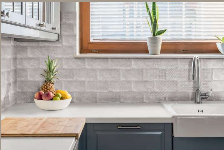
Deco Camden Grey 10x20 · 4"x8"