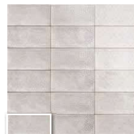
DECOR CAMDEN GREY 10x20 (M 220) 4"x8"