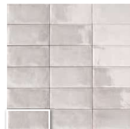
CAMDEN GREY 10x20 (M 190) 4"x8"