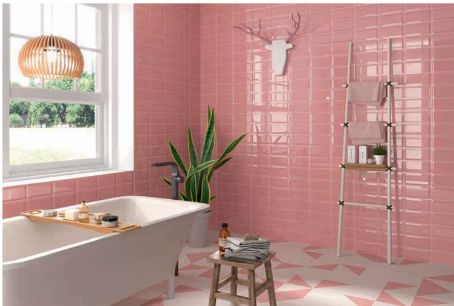
Bissel Pink 10x20 · 4"x8" · Fired Middle Pink 20x20 · 8"x8" · Riga White 20x20 · 8"x8" (Ver serie completa en / Check complete serie in PORCELAIN BOOK COLLECTIONS 2022 OPTYM)