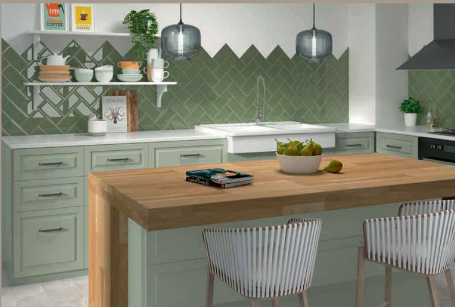
98 Bissel G-Olive 10x20 - 4"x8" Scudo Bianco 20x20 - 8"x8" (Ver serie completa en / Check complete serie in PORCELAIN BOOK COLLECTIONS 2022 OPTYM)