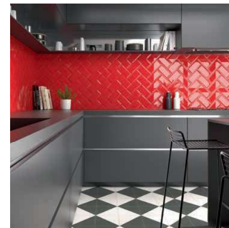
Bissel Rubi 10x20 · 4"x8" · Fired Middle Black 20x20 · 8"x8" (Ver serie completa en / Check complete serie in PORCELAIN BOOK COLLECTIONS 2022 OPTYM)