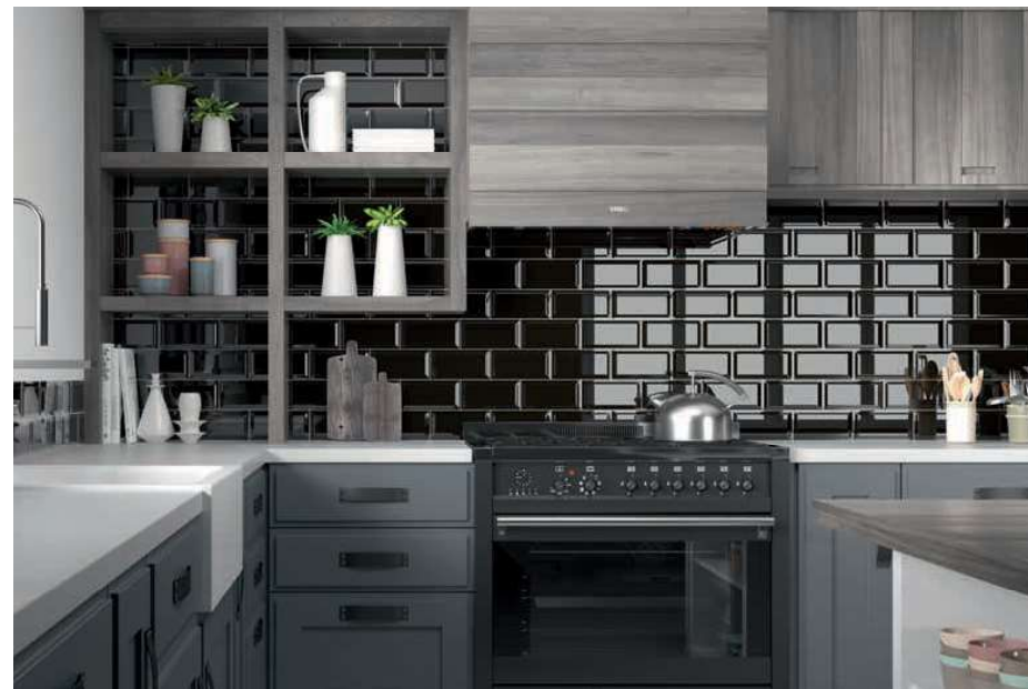
Bissel Negro 10x20 - 4"x8"