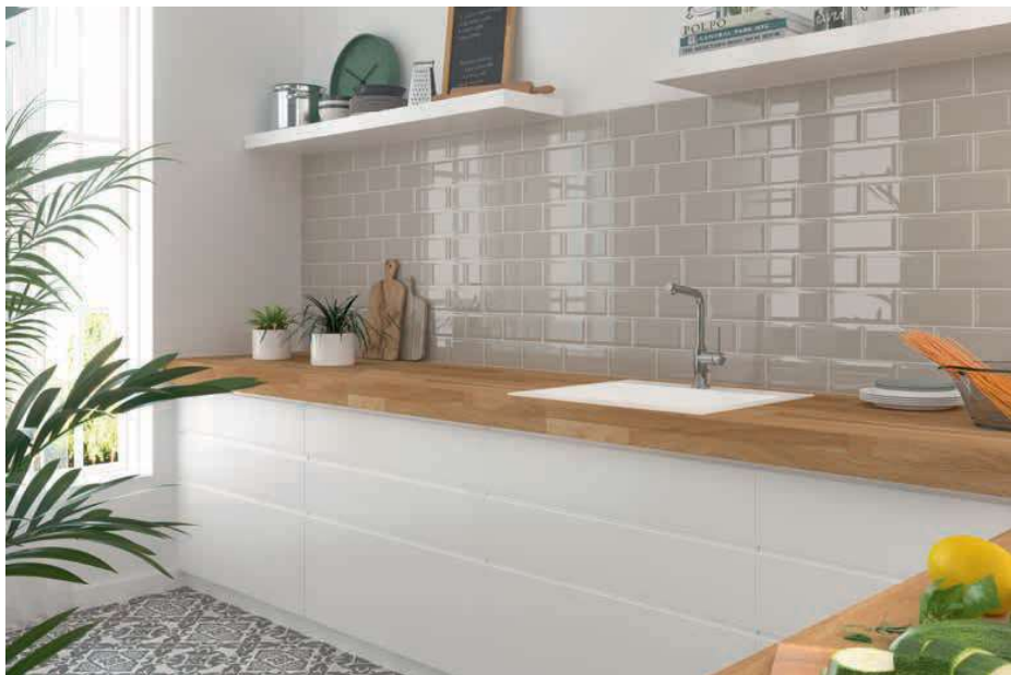
Bissel Pearl 10x20 · 4"x8" · Versailles colonial 20x20 · 8"x8" (Ver serie completa en / Check complete serie in PORCELAIN BOOK COLLECTIONS 2022 OPTYM)