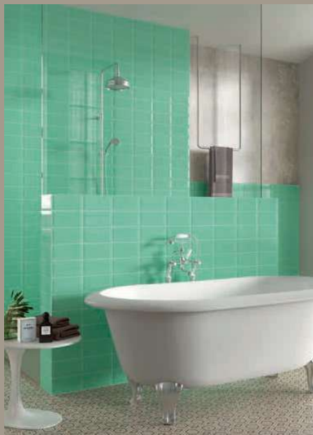
Bissel Emerald 10x20 - 4"x8" - Oslo 20x20 - 8"x8" (Ver serie completa en / Check complete serie in PORCELAIN BOOK COLLECTIONS 2022 OPTYM)