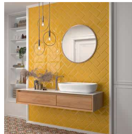
Bissel Tiger 10x20 · 4"x8" · Centro Gotic 20x20 · 8"x8" (Ver serie completa en / Check complete serie in PORCELAIN BOOK COLLECTIONS 2022 OPTYM)