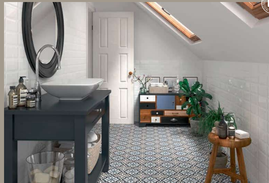
Bissel Blanco 10x20 · 4"x8" · London 20x20 · 4"x8" (Ver serie completa en / Check complete serie in PORCELAIN BOOK COLLECTIONS 2022 OPTYM)