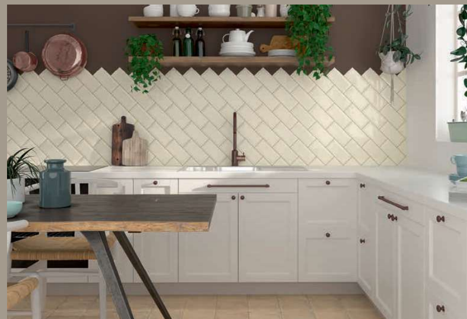
Bissel Vison 10x20 · 4"x8" · Scudo Cream 20x20 · 8"x8" (Ver serie completa en / Check complete serie in PORCELAIN BOOK COLLECTIONS 2022 OPTYM)