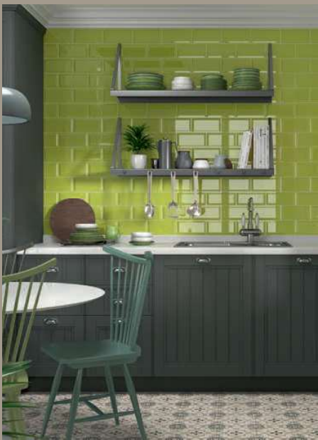
Bissel Y-Green 10x20 - 4"x8" - Celtic 20x20 - 8"x8" (Ver serie completa en / Check complete serie in PORCELAIN BOOK COLLECTIONS 2022 OPTYM)