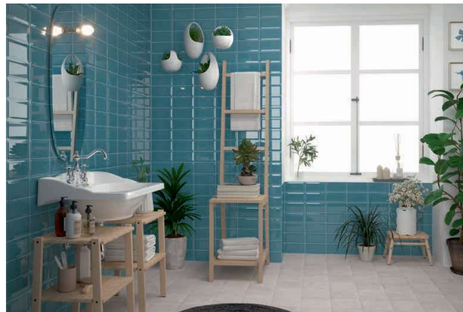
White Bali Stone 20x20 - 8"x8" (Ver serie completa en / Check complete serie in PORCELAIN BOOK COLLECTIONS 2022 OPTYM) Bissel Blu Grey 10x20 - 4"x8"