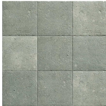
MZ20STONE-G Green Stone 20x20 MZ-280