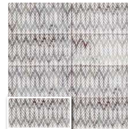
GAIA WHITE 15x30 (M 220) 6"x12"