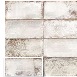
ATELIER WHITE 15x30 (M 190) 6"x12"