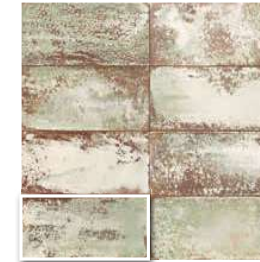
ATELIER KALE 15x30 (M 190) 6"x12"