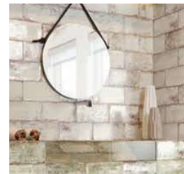
Atelier Kale 15x30 · 6"x12" Atelier White 15x30 · 6"x12"