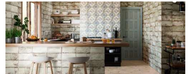
Atelier Kale 15x30 · 6"x12" · Apollini 15x30 · 6"x12" · Aterra Crema 15x30 · 6"x12" (Ver serie completa en pág. 171 / Check complete serie in page 171)