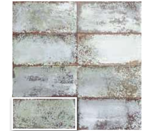
ATELIER PARADISE 15x30 (M 190) 6"x12"