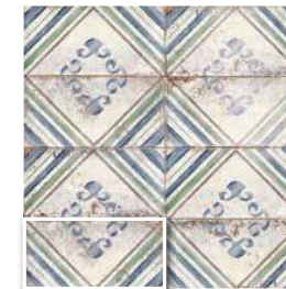
APOLLINI 15x30 (M 220) 6"x12"