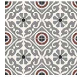
Musa Grey 33,15x33,15 / 13,1"x13,1"