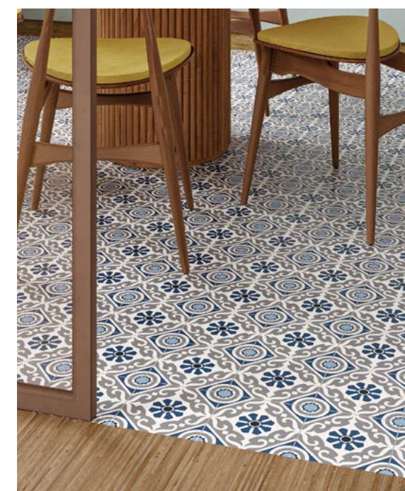
Taco Musa Blue 16,5x16,5 / 6,5"x6,5" Lama Roble Natural 20x120 / 7,9"x47,3"