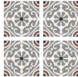
Taco Musa Grey 16,5x16,5 cm / 6,5"x6,5"

33,15x33,15 cm / 13,1"x13,1" 16,5x16,5 cm / 6,5"x6,5"