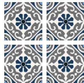
Taco Musa Blue 16,5x16,5 cm / 6,5"x6,5"