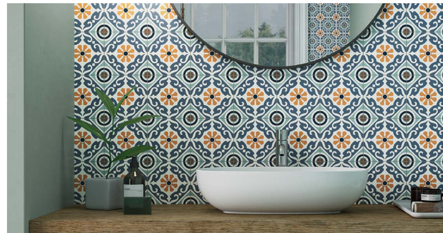
Taco Musa Mix 16,5x16,5 / 6,5"x6,5"