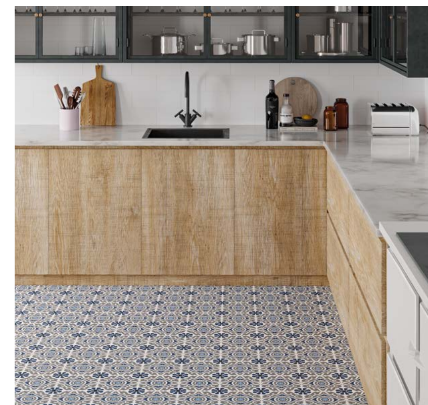
Taco Musa Blue 16,5x16,5 / 6,5"x6,5" · Brick Neutral Blanco 11x33,15 / 4,3"x13,1"