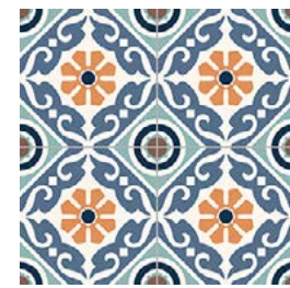
Musa Mix 33,15x33,15 / 13,1"x13,1"