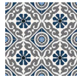
Musa Blue 33,15x33,15 / 13,1"x13,1"