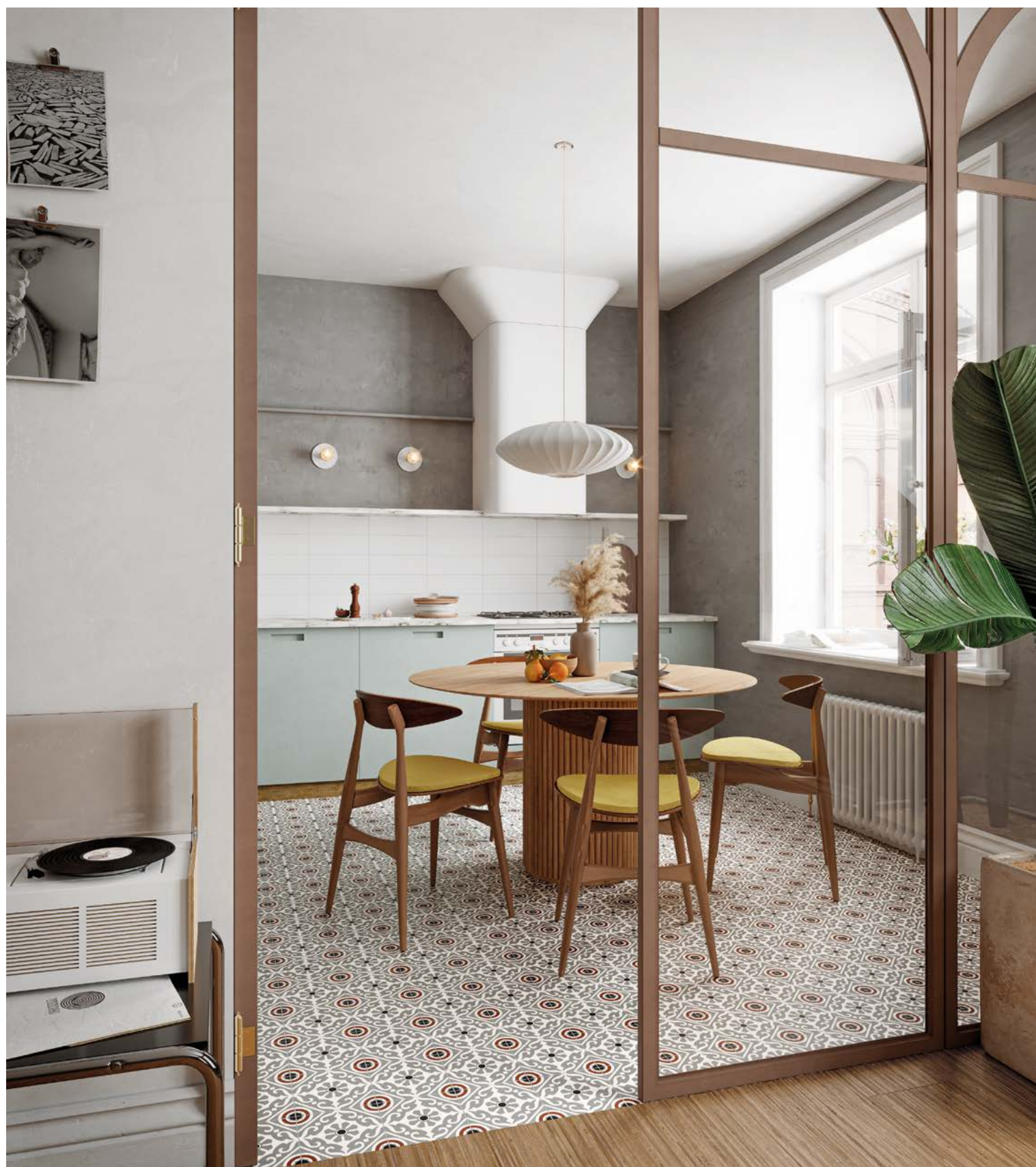
Taco Musa Grey 16,5x16,5 / 6,5"x6,5" · Lama Roble Natural 20x120 / 7,9"x47,3" · Brick Neutral Blanco 11x33,15 / 4,3"x13,1"

33,15x33,15 cm / 13,1"x13,1" 16,5x16,5 cm / 6,5"x6,5"