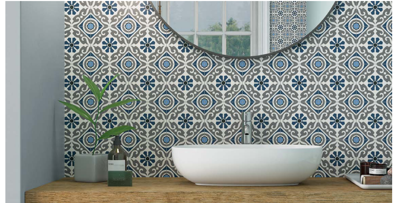
Taco Musa Blue 16,5x16,5 / 6,5"x6,5"