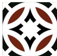
CA20NOVE-BK Novecento Black 20x20 CA-66