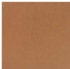
BS31PRENSA Prensado Natural 31,6x31,6