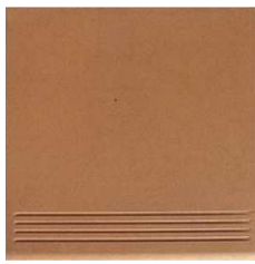
BS31PRENSA-P Peldaño Prensado Natural 31,6x31,6