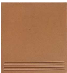
BS28PRENSA-P Peldaño Prensado Natural 28x31