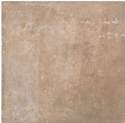
Base Stone C1 31,6 x 31,6 cm