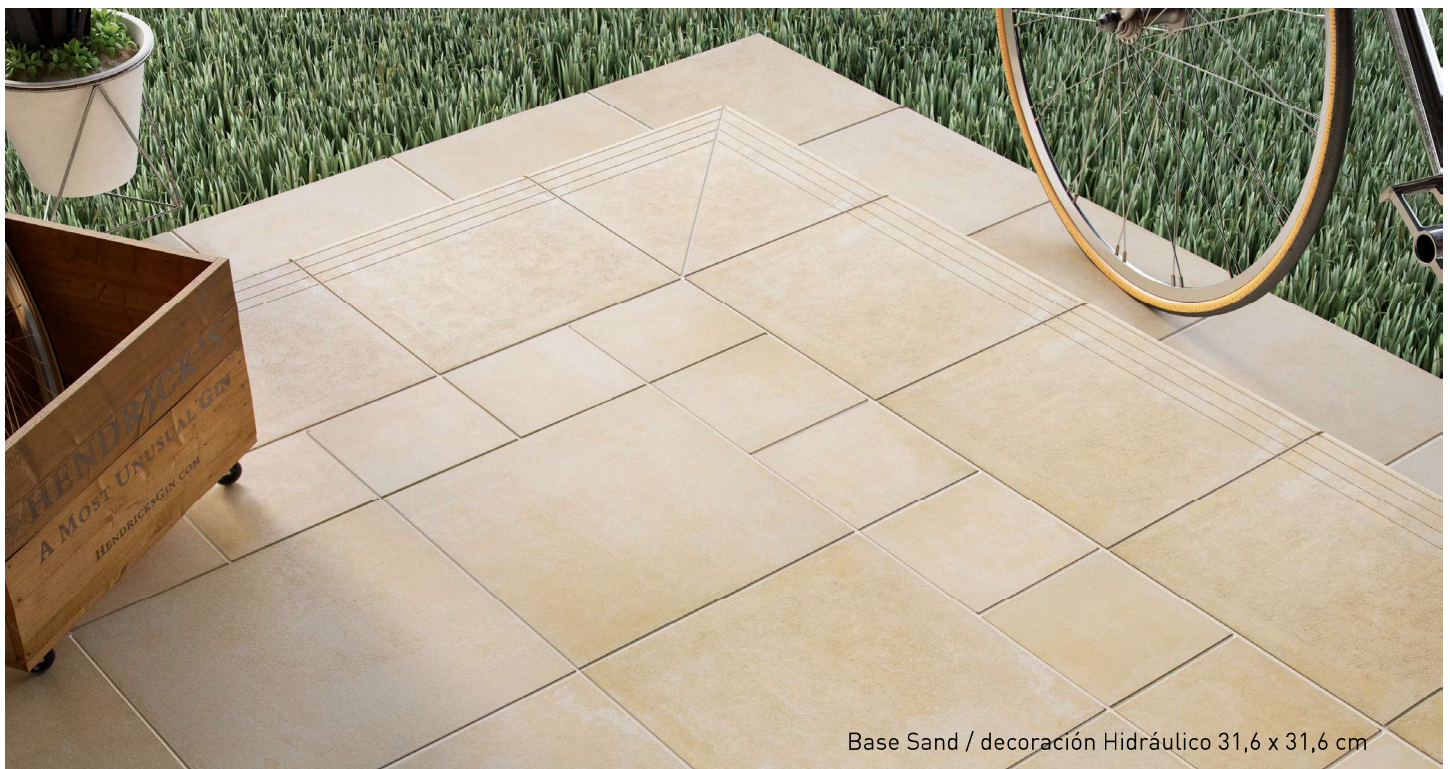
Base Sand / decoración Hidráulico 31,6 x 31,6 cm