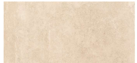
Tabica Sand C1 15,7 x 31,6 cm