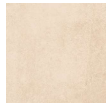
Taco Sand 15,7 x 15,7 cm