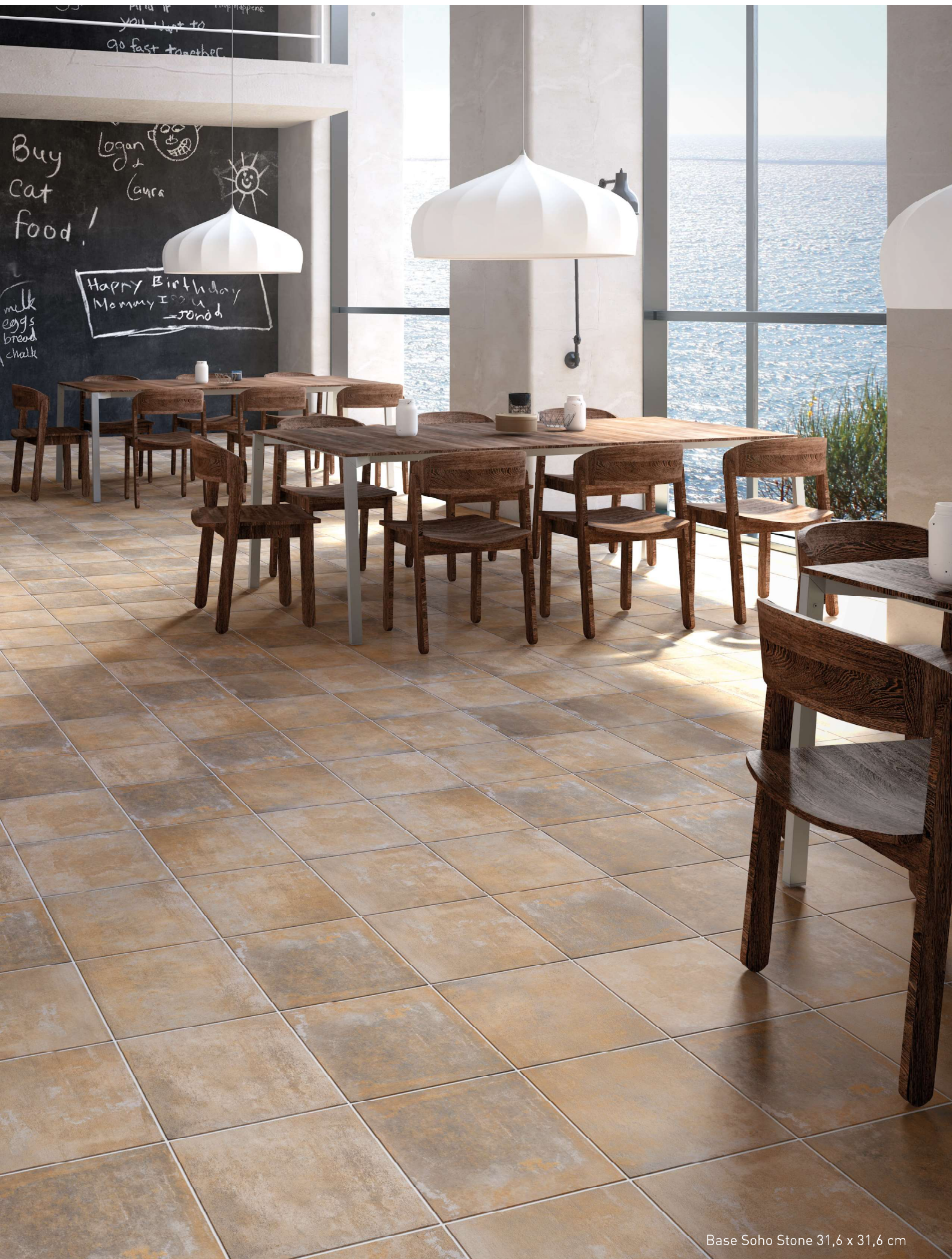
Base Soho Stone 31,6 x 31,6 cm