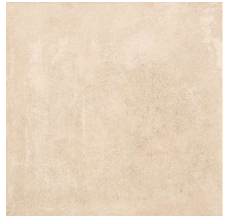
Base Sand C1 31,6 x 31,6 cm