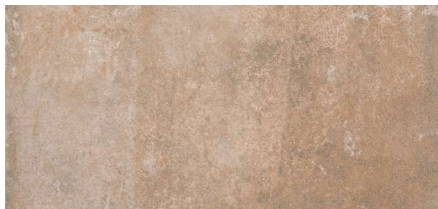
Tabica Stone C1 15,7 x 31,6 cm