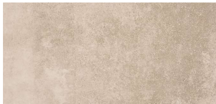
Tabica Cement C1 15,7 x 31,6 cm