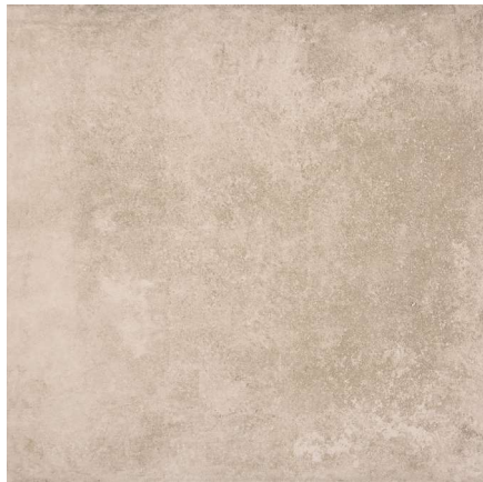
Base Cement C1 31,6 x 31,6 cm