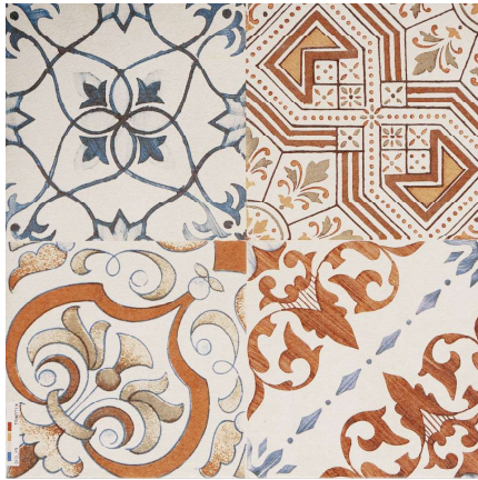
Deco Hidráulico C1 31,6 x 31,6 cm