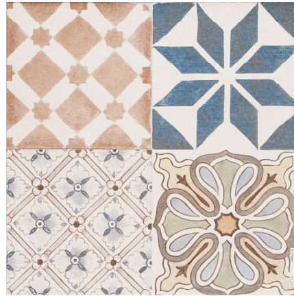
Deco Hidráulico C3 31,6 x 31,6 cm