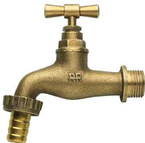
200 - GRIFO CON CONEXIÓN EN LATÓN AMARILLO