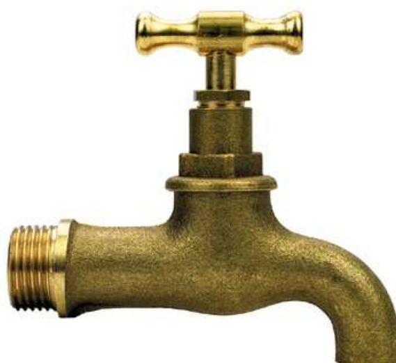
201 - GRIFO CURVADO EN LATÓN AMARILLO